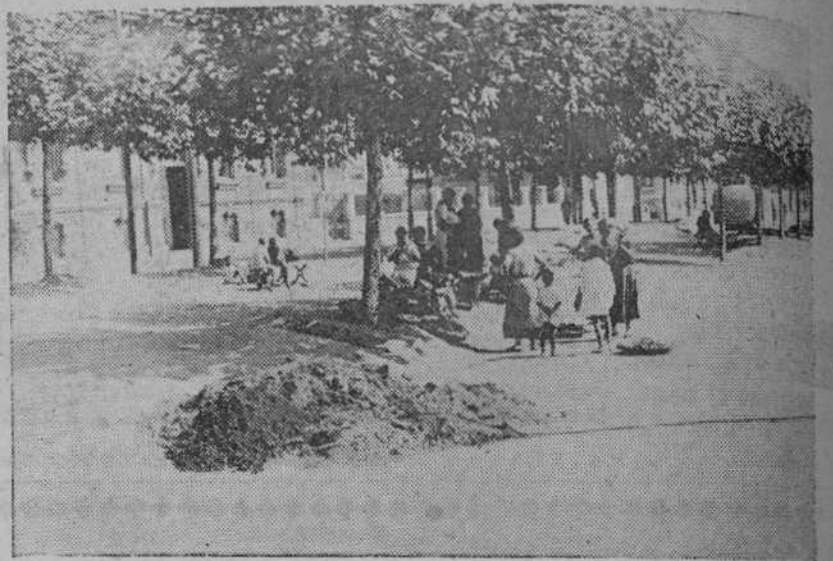
Junto a este basurero y sobre los macizos asolados, las mujeres del barrio...

Ya hemos rebasado la última casa del muelle, la de la Cervecería. Ya estamos en la Avenida de Molnedo y en la calle de Castelar, donde empieza el barrio de Salamanca, de Santander. Casas suntuosas, que recuerdan las de las