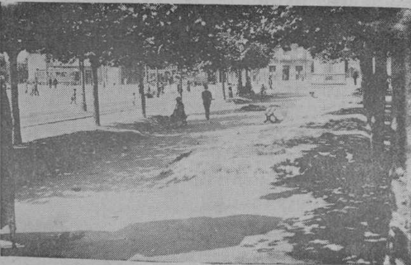
Esta zona de desolación y de abandono que recuerda el "no man's land" de la Gran Guerra...

El pueblo es quien ha de juzgar en última instancia.