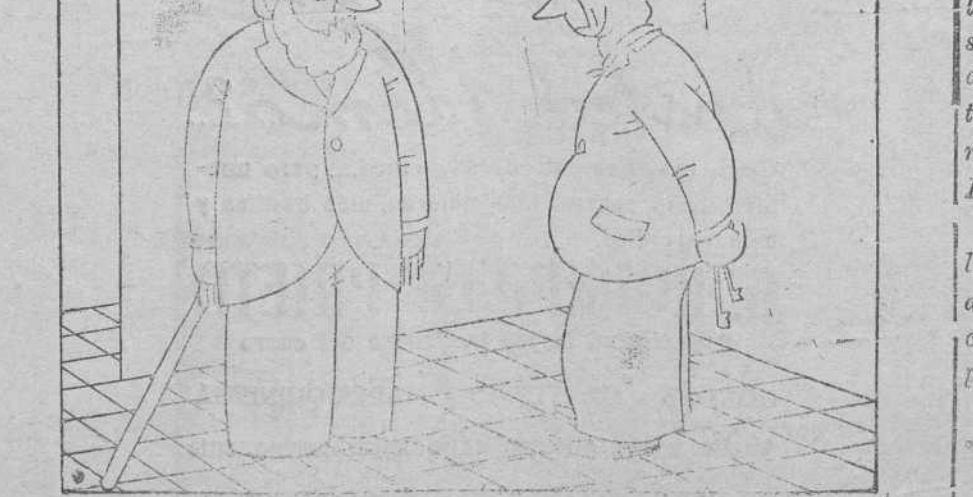
—El Inquilino.—No me disgusta este cuarto, pero me falta una alcoba; me falta un cuarto de baño... El dueño.—¿Y sospecha usted de alguien?