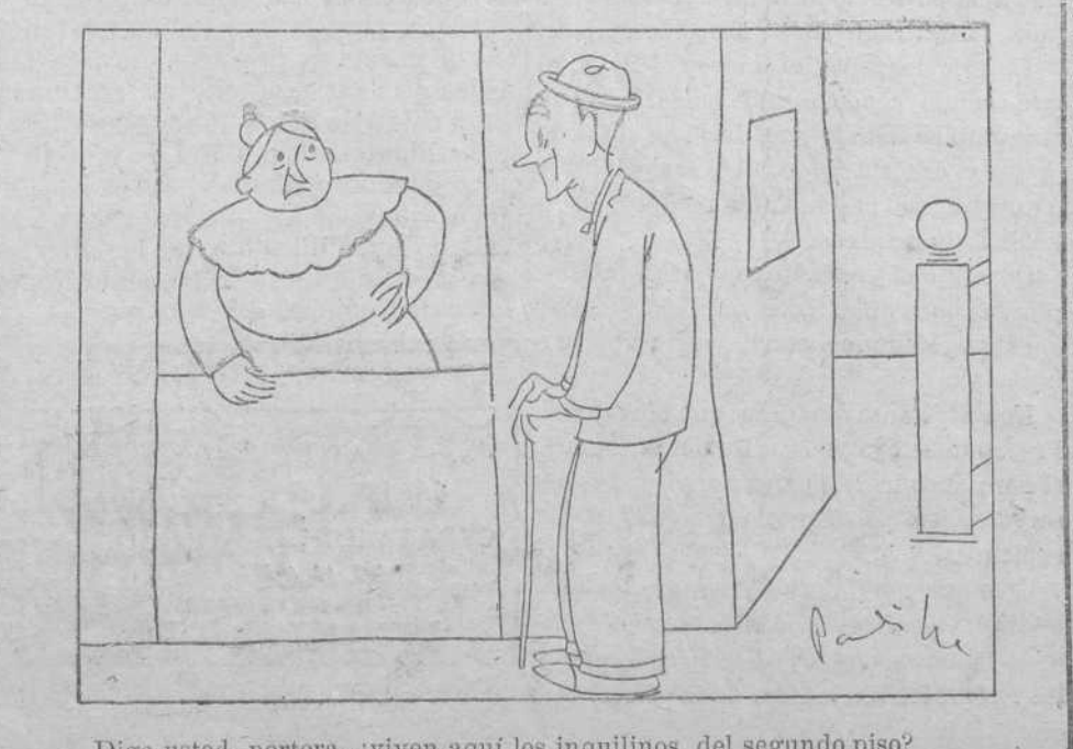
—Diga usted, portera, ¿viven aquí los inquilinos del segundo piso?