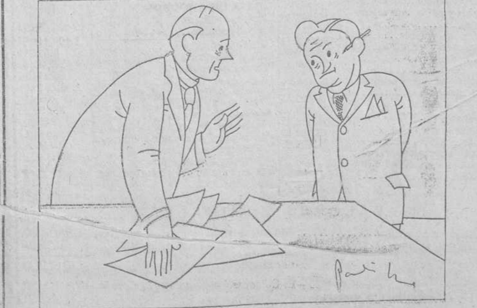
—Su compañero rinde doble trabajo que usted. —Ya se lo digo yo, pero no me hace caso.