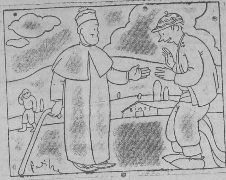
—Tu mayor enemigo es el vino, Tanasio. No tienes enmienda. —Pero no dice usted que a nuestro enemigo debemos amarle? —Sí; pero no digo que debemos «tragarlo».