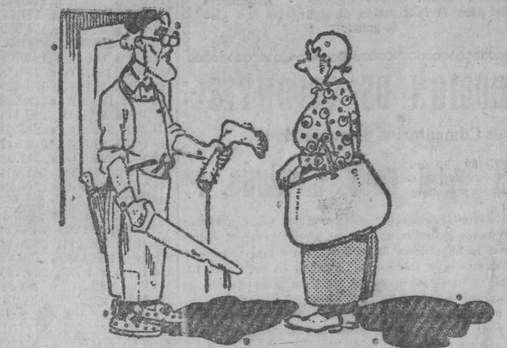
El médico cirujano.—Descuide usted, señora, está en mis manos. Haré de su marido todo cuanto la ciencia me permite.

Durante el día de hoy, ha continuado la recogida de muestras de leche y vino por la Junta provincial de Abastos, con resultado desfavorable para los desaprovisores.