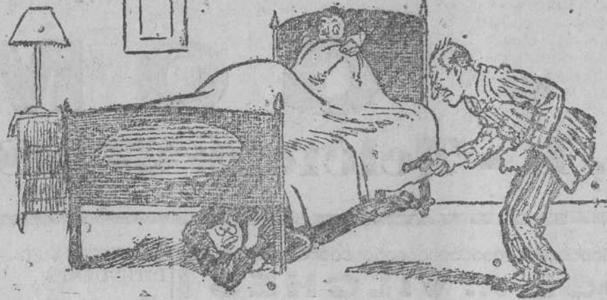
--El jefe de la familia.--¿Qué está usted haciendo aquí? El de debajo la cama.--¡No tire amigo! Yo soy un alforador que busca trabajo.

En la «Gaceta» se publica una relación de familias numerosas, a las que se ha concedido el beneficio de los subsidios y entre las que se cuentan varias de esta provincia.