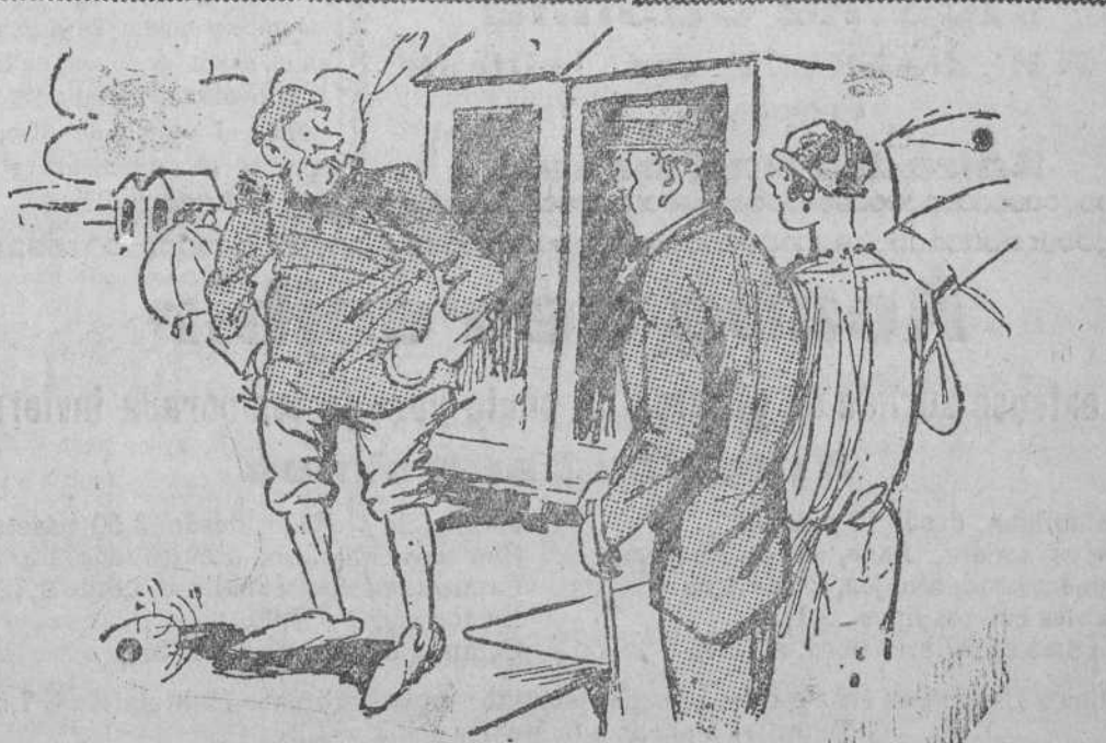
EN LA PLAYA

— Oiga bañero, ¿usted sabe nadar? — ¿Yo? ¡Yo hago la plancha dos horas, buceo quince metros, me sumerjo cuatro minutos!.. — Bien; pero yo quiero saber si V. sabe nadar.