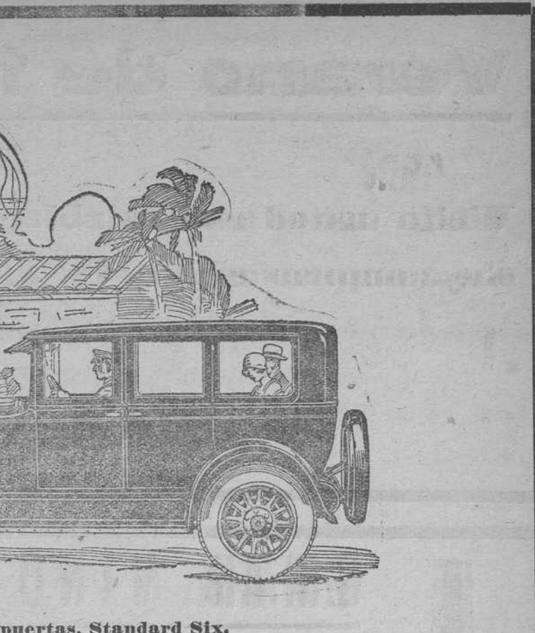
Buick, Sedan cuatro puertas, Standard Six.