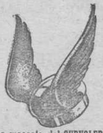
La mascota del CHRYSLER

No puede usted saber que es superior al mejor.