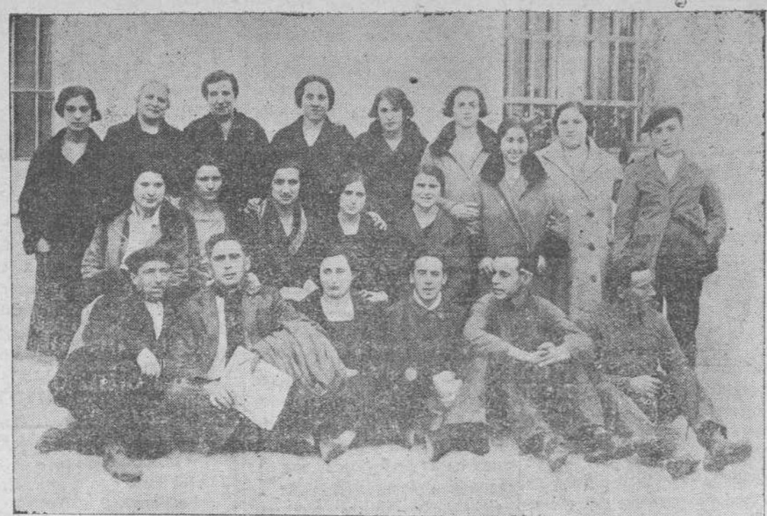
Grupo de cigarreras y operarios de la fábrica de Tabacos, en uno de los patios.

Esta noche, en el "Cristóbal Colón", embarcará con su distinguida familia el notable primer actor Enrique Lacasa, el farandulero que durante más veinticinco años, estuvo en Santander el carro de las Cortes de la Muerte, que a él le llevaba. Enrique Lacasa se dirige a la Habana, en uno de cuyos principales teatros actuará. Lleve buen viaje el excelente actor y su distinguida familia y sinceramente le deseamos nuevos triunfos en los escenarios americanos, donde ha sido aplaudido tantas veces.