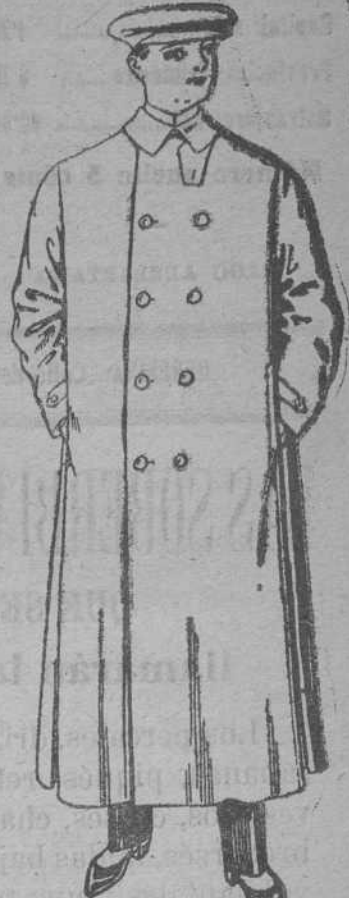
GUARDA-POLVOS de drill y seda, para caballero, desde PTAS. 6