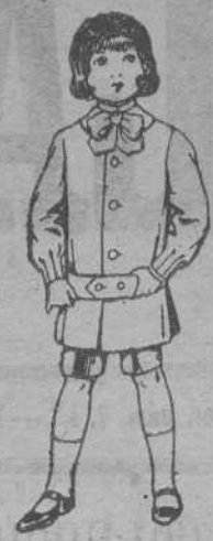
TRAJES MODELO CASACA para niños á PESETAS 12