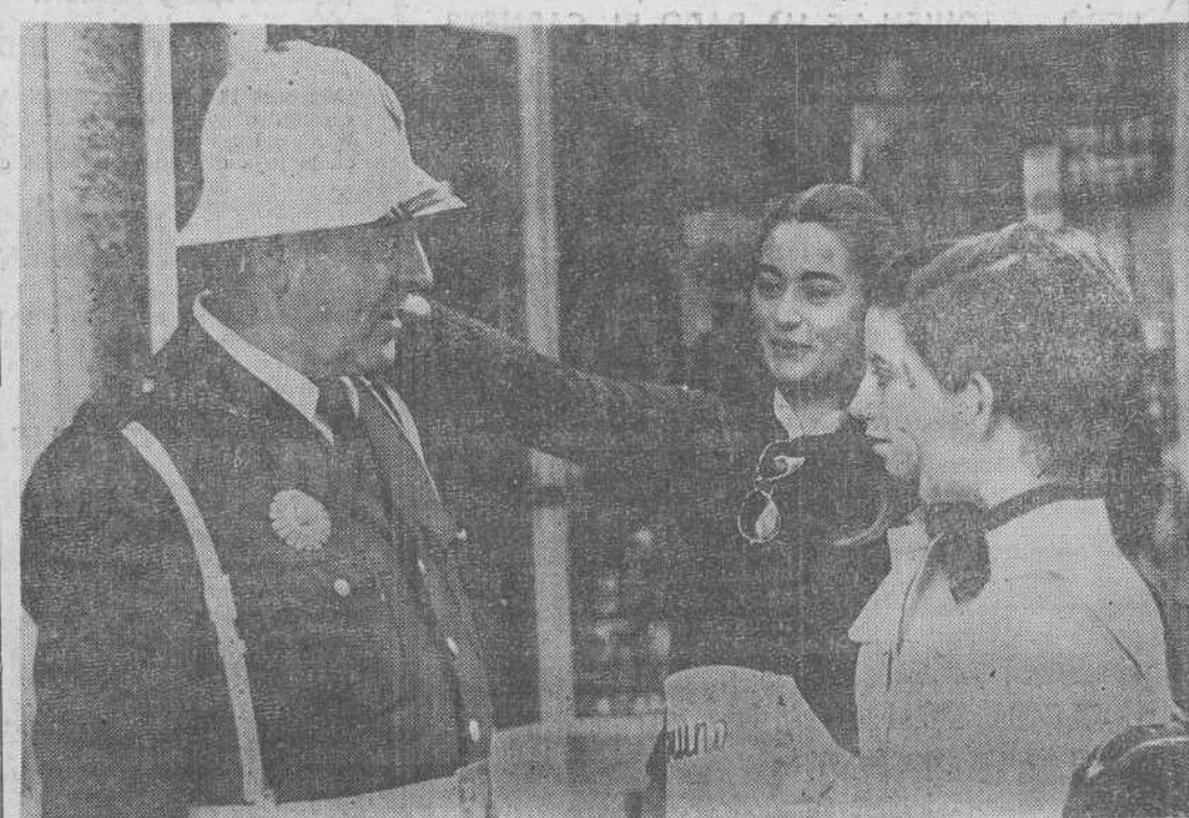
Jornada misionera la de ayer en nuestra ciudad. Legioneros de niñas postularon por las calles para recaudar donativos en favor de las Misiones. En los templos la predicación estuvo dedicada a una gran obra de la Iglesia. En la foto de Bustamante, un detalle de la concentración en la vía pública.