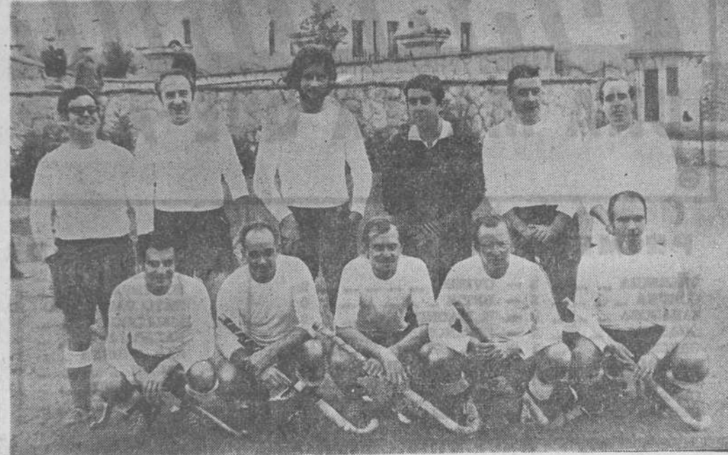
HOCKEY SOBRE HIERBA.—Ante el comienzo de la Liga provincial de hockey sobre hierba, ayer se enfrentaron el equipo del Tennis (arriba) y el «Traba».