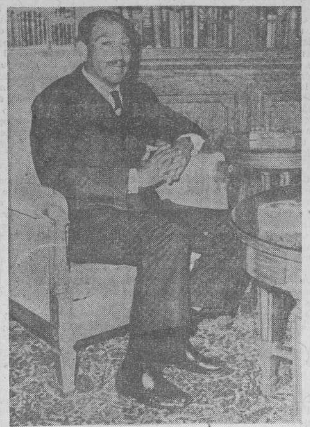
EL GOBIERNO DE EL CAIRO LO DESMIENTE

Se dio lectura a un mensaje personal al Congreso del ministro español de Trabajo, don Licinio de la Fuente, que elogia las virtudes tradicionales de la emigración española a los países iberoamericanos, invita a la labor comunitaria y a la constitución de federaciones a nivel regional y compromete todo el apoyo de su Ministerio y del Instituto Español de Emigración para vigorizar y asegurar la permanencia de esos centros.