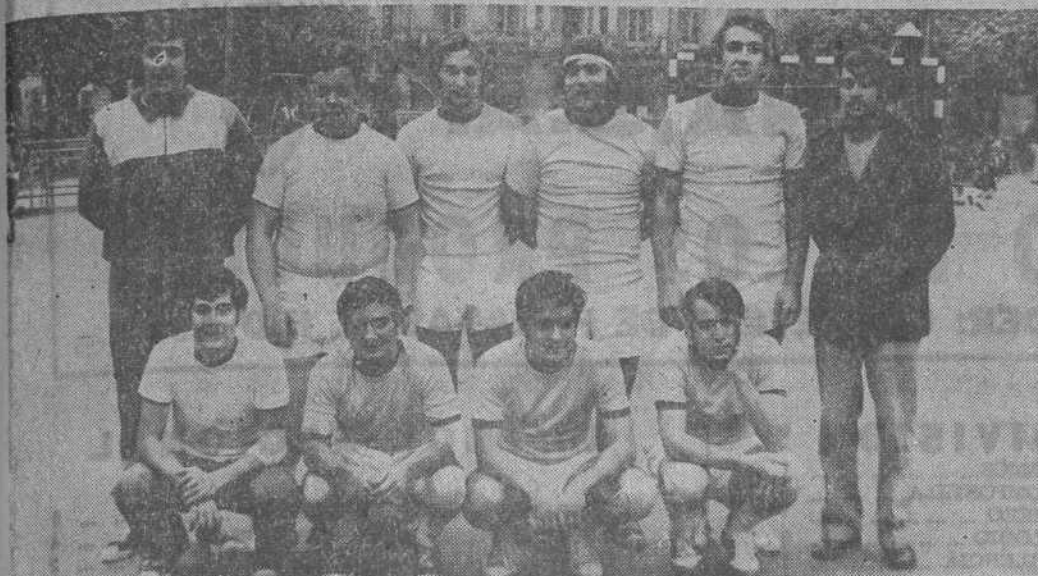
Ayer dio comienzo la Liga de balonmano, enfrentándose, en la cancha de la Plaza José Antonio, los equipos Librería Revuelta y C. Vidal Abascal. Enia foto (arriba), Librería Revuelta, (abajo) Vidal Abascal.