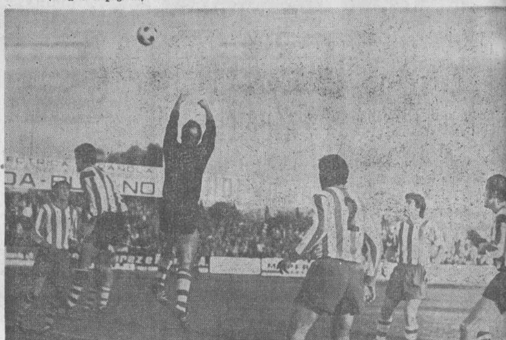
Ante el acoso de los gimnásticos, el meta del Llodio, Cayón, despeja de puños.

CORNERS: Quince lanzó a Gimnástica, cuatro en el primer tiempo y once en el segundo, por ninguno el Llodio.