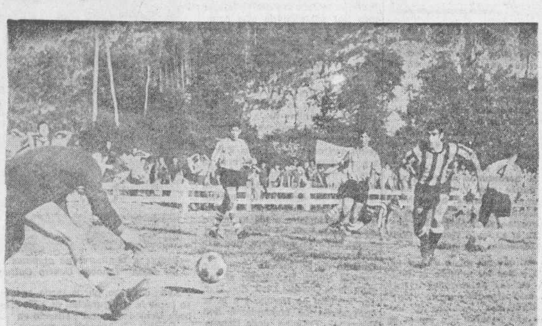
El portero del Bilbao Atlético se hace con un balón que intentaba rematar un delantero del Escobedo. (Foto M. BUSTAMANTE).

Los bilbaínos se adelantaron con dos goles, que rápidamente igualaron los del Escobedo