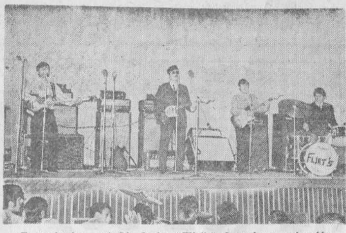
El conjunto montañés de los "Flirt's" durante su actuación en el salón Kostka.

Una vez terminada la época veraniega vuelven a celebrarse los festivales de música moderna que tanto abundan en nuestra ciudad. La temporada se ha inaugurado con un espectáculo celebrado en el estadio de fútbol, en cuya sala no había ninguna butaca libre y hubo gente de pie por no tener acomodo. Agradaron los grupos que actuaron en este primer festival ye-ye de la temporada 1967-68.