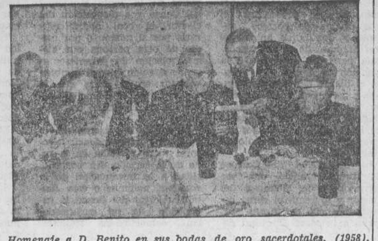
Homenaje a D. Benito en sus bodas de oro sacerdotales. (1958).

En esa línea de renovación, que no es nueva, fijaba don Benito su atención hace tiempo. Dígalo si no el aparejador de la parroquia, que había presentado un presupuesto de 30.000 duros para el arreglo y conservación. El fontanero, lo mismo, para canalones y limas de zinc y estaba en estudio la calefacción, obras preteritorias y que junto al ornato de cancela, baptisterio, altar mayor, etc., etc., suman un gran dispendio, que no tenemos, pero confiamos. Si queréis comprometeros los de un gremio, por una obra particular, agradecidos, será vuestra. Si queréis por familias, o por calles... es lo mismo. Que no falte nadie que se precie de Consolación, de antes o de ahora; viva en ella actualmente o no, entre los generosos benefactores de la parroquia.