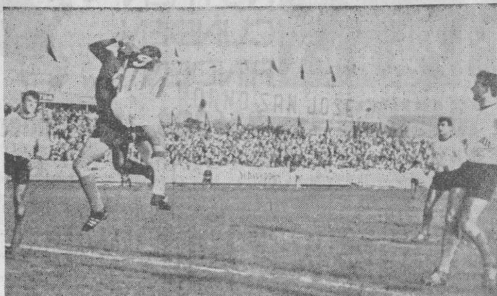
El portero del Mestalla se anticipa a la acción de Gradín y se hace con el balón, que éste intentaba rematar de cabeza.

Las circunstancias nos habían impedido ver a la Gimnástica en la presente temporada, hasta ayer. Eran varios y contradictorios los informes que teníamos acerca del valor exacto del equipo. Frente a este primer encuentro de Copa, tenía a un Mestalla con buen estilo técnico, con perfecto dominio de la situación en el campo, pero con movimientos lentos —así nos parecieron—, aunque muy peligrosos en los contraataques. El resultado ha sido decepcionante: 1-0 en contra de los gimnásticos. No podríamos decir que haya sido un resultado injusto, y, sin embargo, la Gimnástica, al menos en los primeros veinte minutos de la primera parte, mereció marcar. Fueron éstos los me-