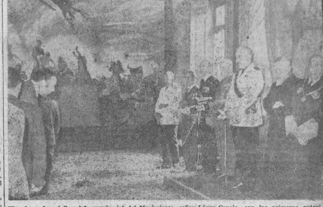
El gobernador civil y jefe provincial del Movimiento, señor López Cancio, con las primeras autoridades, durante la recepción celebrada ayer en la conmemoración de la Exaltación del Generalísimo a la Jefatura del Estado.