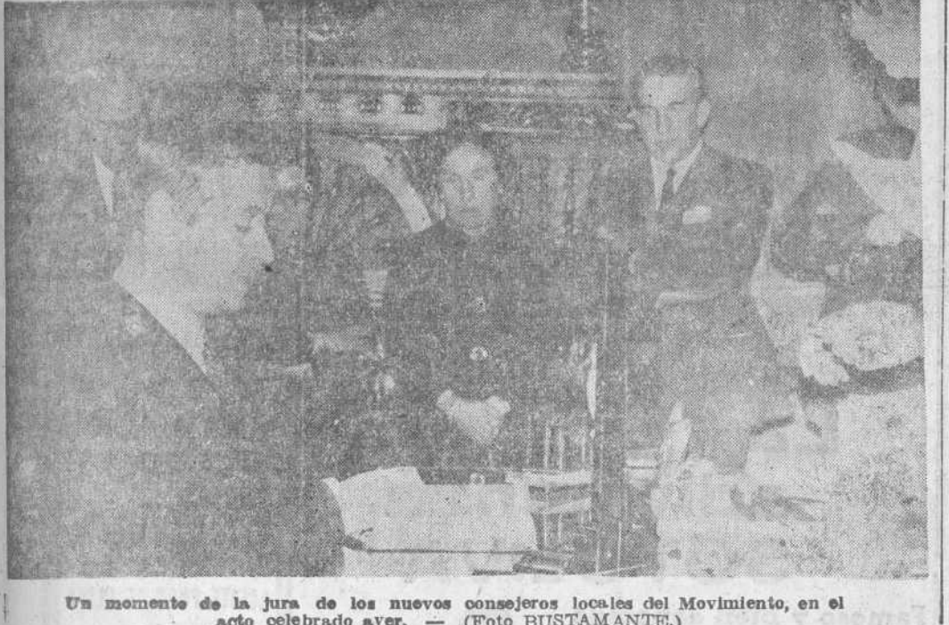
Un momento de la jura de los nuevos consejeros locales del Movimiento, en el acto celebrado ayer.