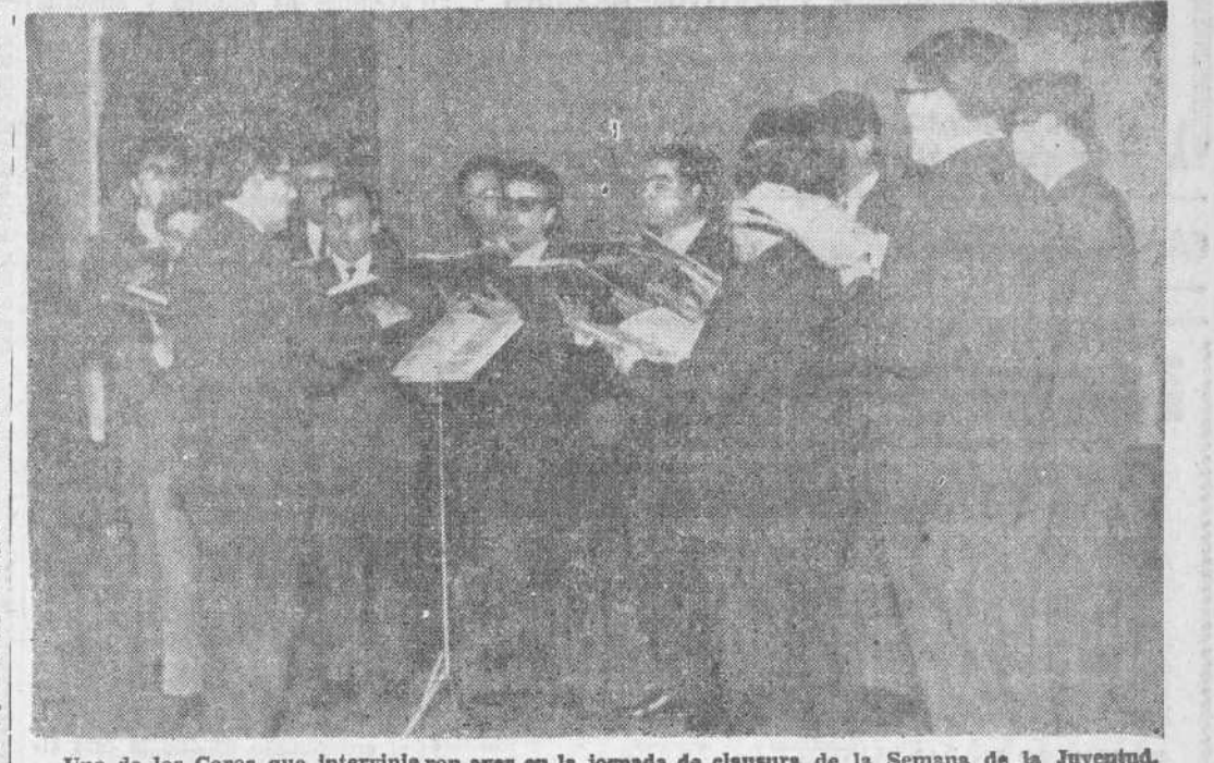
Uno de los Coros que intervinieron ayer en la jornada de clausura de la Semana de la Juventud.