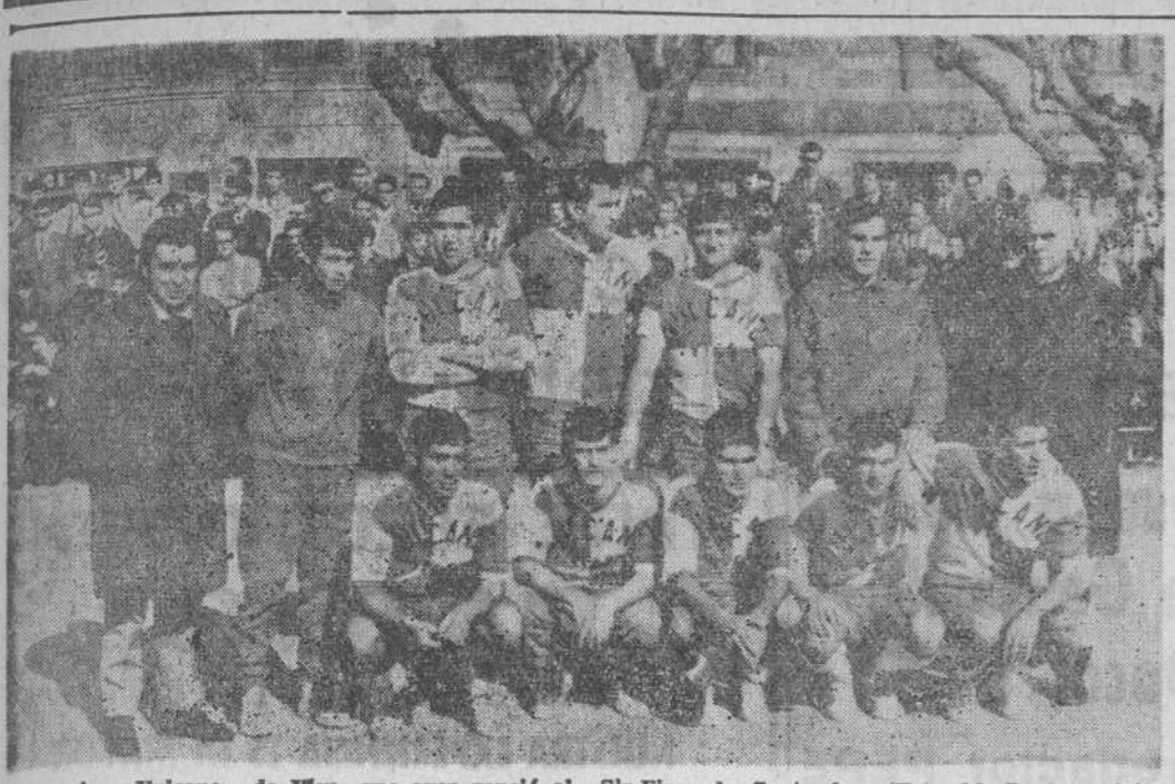
El equipo «Vulcano», de Vigo, que ayer venció al «Sin-Fin», de Santander.

Baionmano.-Primera División El Vulcano de Vigo derrotó al Manufacturas Sin-Fin por 28-15 Cerca de 3.000 espectadores presenciaron este encuentro en la Plaza de José Antonio