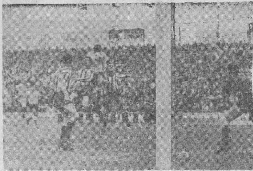
Esta jugada pudo haber sido el tan esperado y no llegado gol del Racing. Raba remató de cabeza —como se aprecia en la foto— un golpe franco sacado por Gento II. Ya se cantaba el gol cuando en la misma raya, y en forma forzada, Cárdenas sacó el balón, salvando la situación. Otra jugada parecida a ésta se produjo en el primer tiempo, con idéntico resultado de sacar la pelota en la misma raya de la portería.

Un nuevo partido en el Sardinero, una nueva derrota. El Racing perdió su cuarto partido consecutivo el 11 de diciembre se perdió con el Oviedo.