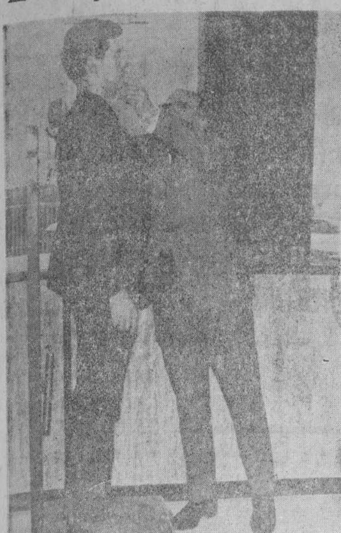
Ayer, domingo, se procedió a la talla de los reclutas del reclutamiento 1967. En la foto, un buen mozo se somete a la primera obligación para el servicio militar, en nuestra capital.