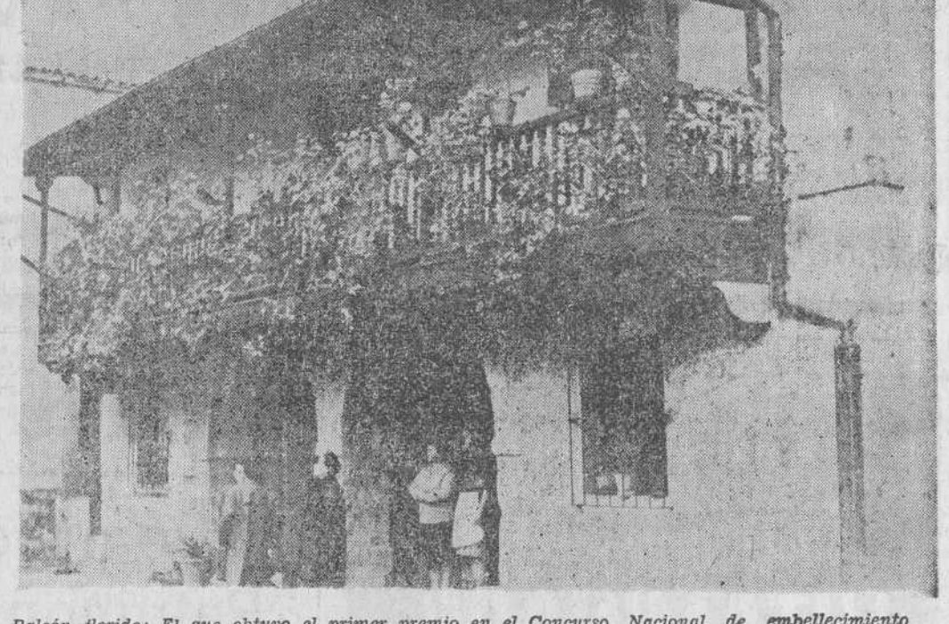
Balcón florido: El que obtuvo el primer premio en el Concurso Nacional de embellecimiento rural, en Liérganes.