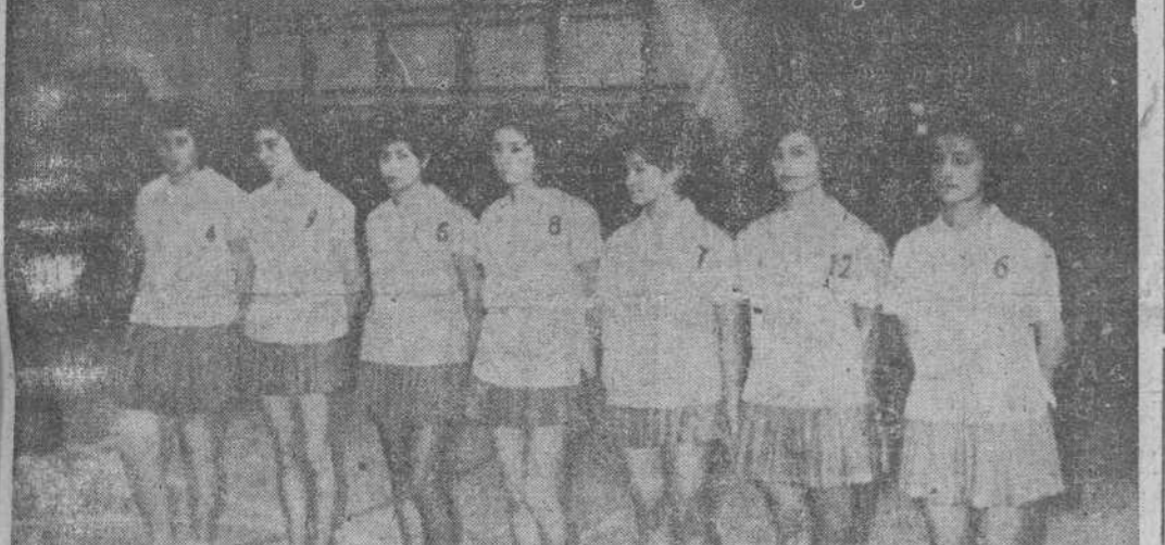
En la cancha del Front de Juventudes y en medio de un gran ambiente, se ha disputado, desde el viernes, el campeonato de España de sector de la Sección Femenina, de baloncesto. Ayer, y en presencia de las autoridades, se disputó la final entre los equipos del Colegio de Carnelitas de Vigo y el del Deportivo de Madrid. Apenas si tuvo color esta final, ya que las madrileñas se impusieron, venciendo por el tanteo de 25-5. En la fotografía, el equipo vencedor, que pasa a la fase final, que se disputará en breve.