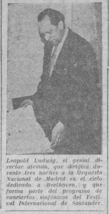
Leopold Ludwig, el genial director alemán, que dirigirá durante tres noches a la Orquesta Nacional de Madrid en el ciclo dedicado a Beethoven, y que forma parte del programa de conciertos sinfónicos del Festival Internacional de Santander.