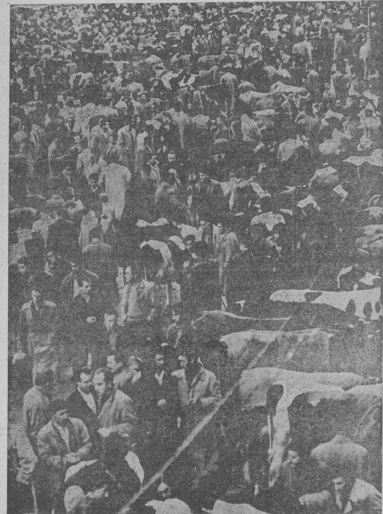
Por ser Torrelavega el centro de contratación de ganado vacuno más importante de España, los primeros y terceros domingos de mes, en que tienen lugar sus renombradas y famosas ferias, La Llama presenta un aspecto como el de la fotografía, lleno de tratantes y ganaderos de todas las regiones y provincias, y atestado de hermosísimas y selectas reses.