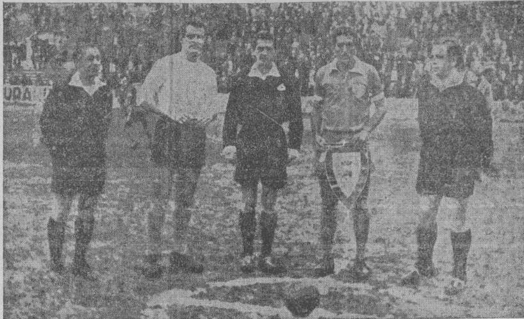
Los capitanes y equipo arbitral del partido de ayer entre el Racing y el Canto do Río. (Foto ARAUNA, hijo).

Los goles ranguistas fueron marcados por Abel y Achiaga