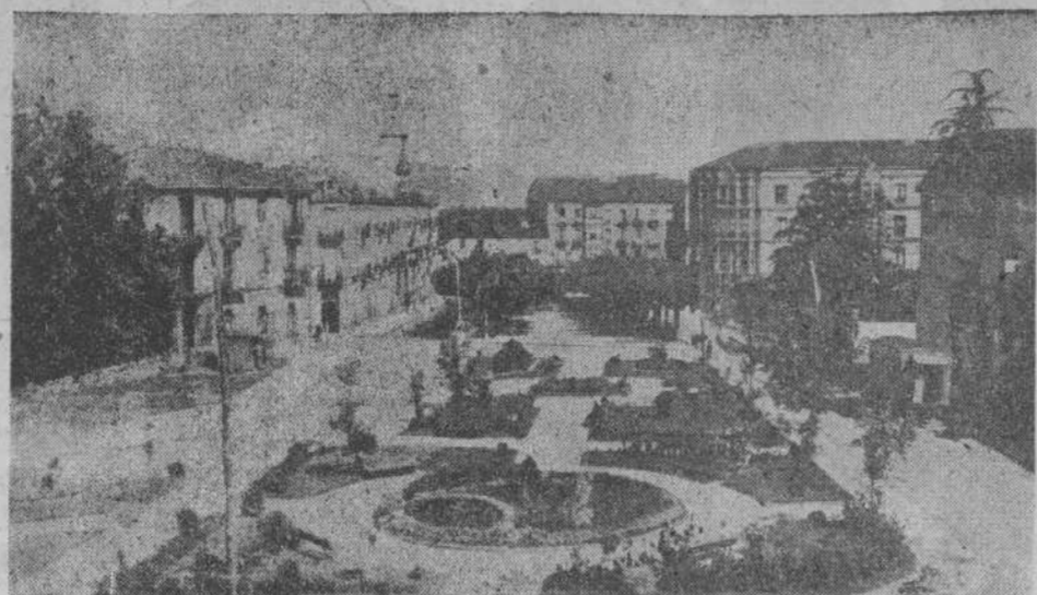
Avenida del Generalísimo. La torre que se ve corresponde al Palacio Municipal.