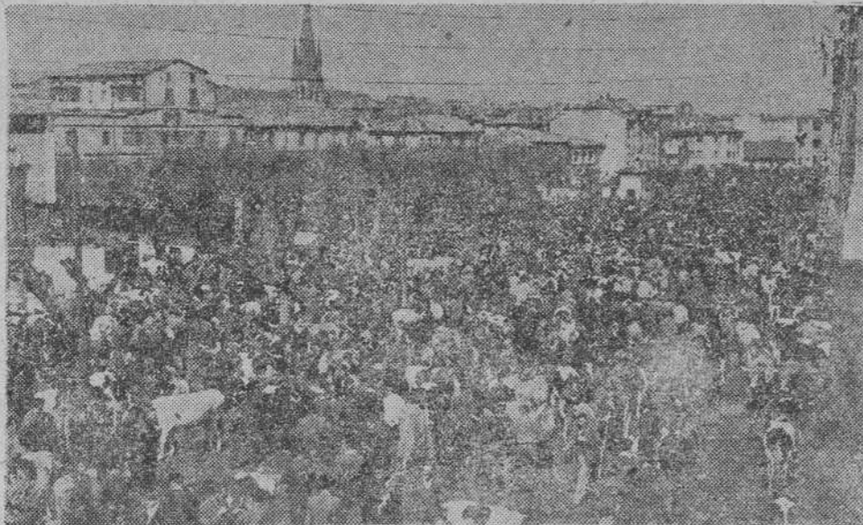
El ferrial de La Llama es el mismo desde que en él se instalaron las famosas ferias torrelaveguenses de ganado vacuno, pero las reses y las transacciones han aumentado de un modo fabuloso. He aquí un aspecto parcial del ferrial de La Llama en la actualidad. Por todas partes sensación de plenitud, desbordamiento de límites...

Dentro de unos días — concretamente el 18 del corriente mes, para continuar por espacio de dos jornadas más — comenzarán en esta emprendedora y moderna ciudad sus famosas ferias de ganado vacuno, caballar y asnal, conocidas de extremo a extremo de España con el nombre de Ferias de Santa María. El hecho que acabamos de señalar por nuestra misión informativa, los que están enterados, saben cuánta trascendencia encierra, cuya importancia es bien obvia. No ignoran ni pueden ignorar que forma parte integrante de la prosperidad actual de un pueblo industrial, la historia del cual, magnífica por cierto, precisamente principia al aparecer sus mercados, los que precedieron con poca diferencia a estas ferias, que son hoy, expresado de una manera generalizada y categórica, las mejores de todo nuestro país en lo que se refiere de un modo especial a la especie bovina, que proporciona unos ejemplares de vida lechera difícilísimo de igualar en producción y selectividad.