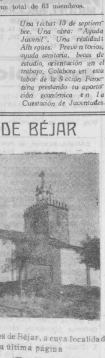
Iglesia parroquial de Fuentes de Béjar, a cuya localidad dedicamos nuestra última página.

Por la época citada se admite que se dejara sentir la necesidad de la feria con mayores motivos que ahora, así que se pueda dejar de reconocer que también existen razones para ello en la fecha actual, y sin duda por eso se celebró aquella, celebrándose también otra en el mes de junio, con duración de quince días, tanto ésta como la anterior.