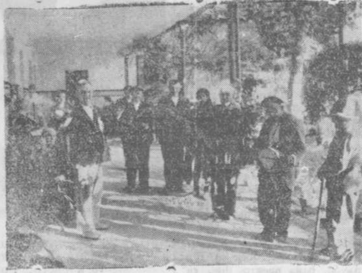
Los ancianitos del asilo pasan las horas alegres y dichosas.

Hemos visitado este asilo de Fuentes de Béjar en varias ocasiones, pero nunca fué como ahora. Era entonces, visita oficial, con autoridades prestigiosas y la visita tenía el carácter de una revista. Los ancianos y ancianas — casi los mismos de hoy — formaban poco menos que en línea militar y respondían con discreta corrección a las preguntas del ministro, del prelado, del gobernador, quienes podían admirar la limpieza y orden de la capilla, de los dormitorios, del comedor y de las cocinas; elogiar el carácter de la fundación y comprobar lo magníficamente atendidos que estaban estos ancianos. Ellos mismos lo decían y en sus rostros animados se comprendía la sinceridad de sus palabras.