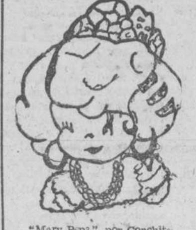
"Mary Pops", por Conchita Davazo