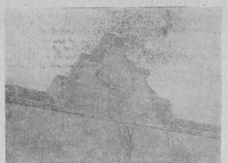
España que corona la puerta de acceso al patio de la Escuela de la Merced, en la que se lee la inscripción que da título al edificio.