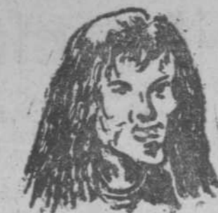
"Zimá", por Celso González de Rollán

EGIDO ANDUJAR MEDICINA GENERAL FEL - SIFILIS - VENEREO Consultas: Doce a dos y seis a nueve Calle de, 5, principal C. S. n.º 2