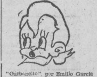
"Garbanito", por Emilio García

Transportes I. F. S. A. Con cargas completas, los efectúa directamente entre todas las capitales de España PASEO DE CARMELITAS, 38 - TELEFONO 1777