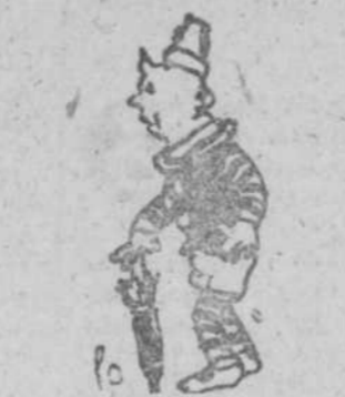
"Pirujo", por Jesús Muñoz Pizarro