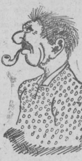
"Mi carbonero", por Tullí Gata