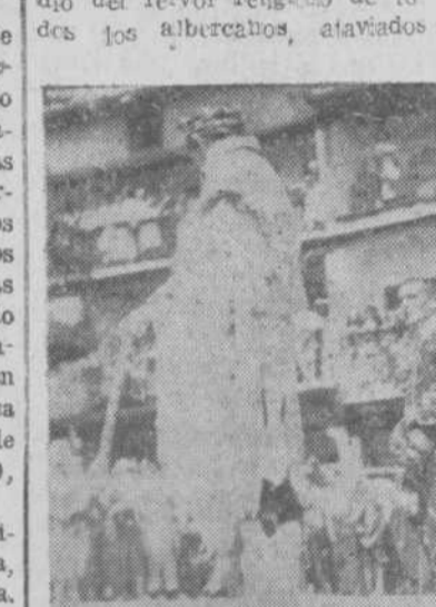
El grupo de danzarinas albercanas, baila en honor del ilustre hispanista.