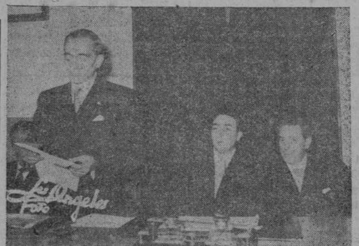
El presidente del Colegio dando lectura a su discurso

vo durante nuestro Movimiento Nacional al Laboratorio Central del Ejército. Posteriormente de ese mpeño puestos de dirección en diferentes Laboratorios veterinarios para la obtención de sueros y vacunas para la ganadería. Infatigable investigador, son muy numerosos sus trabajos sobre profilaxis y tratamientos de enfermedades infecciosas en el ganado vacuno y parasitarias en las aves, destacándose sus constantes estudios sobre las enfermedades rojas del cerdo, sobre la vacuna al cristal violeta contra la Peste Porcina y culminando en la obtención de suero contra el mal rojo del cerdo procedente de esta especie animal. Profesor de la Facultad de León, con callada vocación, pre-