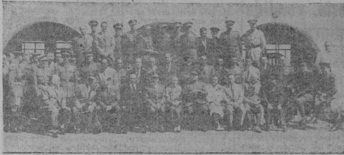
Los participantes en el Concurso Hípico con las autoridades salmantinas

Todos funcionaron perfectamente. Comencemos por alabar el magnífico servicio de transporte montado en combinación con las entradas con los soberbios autobuses, que se relevaron sin cesar al comienzo y final de la prueba. Los altavoces se oyeron perfectamente y emitieron abundantes datos técnicos para la mejor comprensión de lo que se hacía en la pista. Hasta el servicio de Sanidad, que tuvo que acudir una vez, aunque