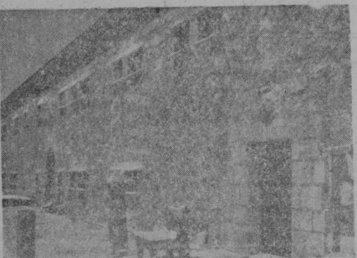
Hospedería de la Peña de Francia