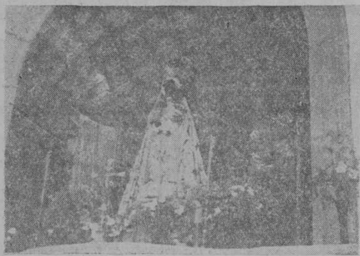
La Virgencita en su nuevo camarín

Otro sentimiento se unió a la manifestación de fe y al amor de la Virgen. Frente al Convento, sobre la cima escabrosa de la ligente montaña, unas ruinas señalaban quizá lo que en tiempos muy remotos debió ser hospedería. No cabe duda que la reconstrucción contribuiría, no ya a aumentar la devoción