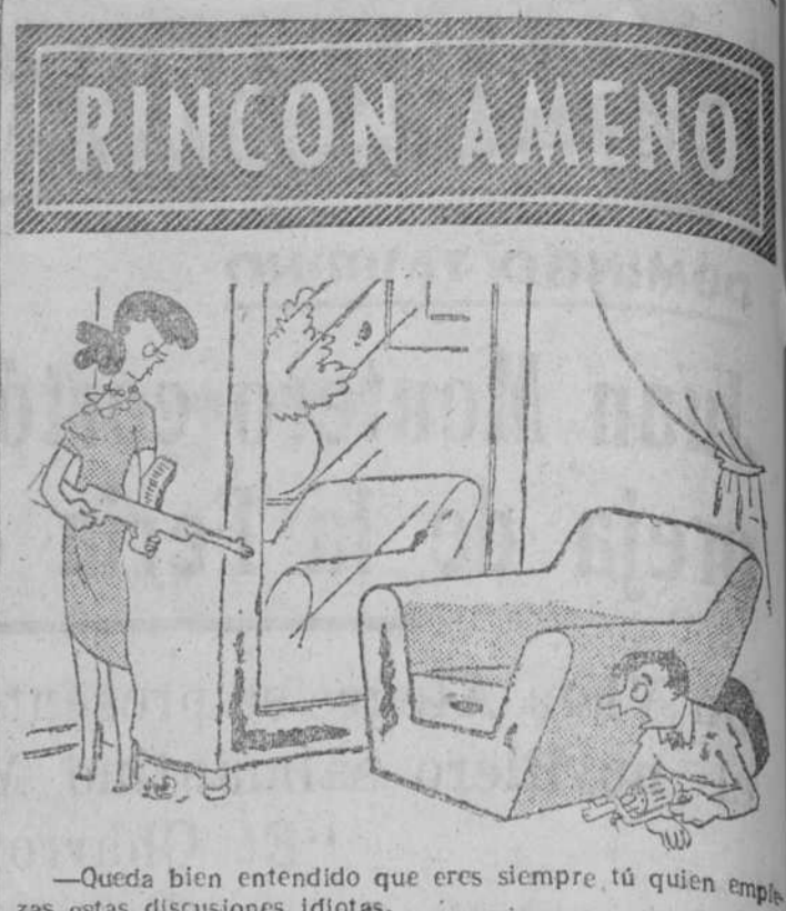
—Queda bien entendido que eres siempre tú quien empiezas estas discusiones idiotas.

El Jurado le declaró finalmente culpable de homicidio sin premeditación, siendo condenado a quince años de prisión, en la penitenciaría del estado en Charlestown.