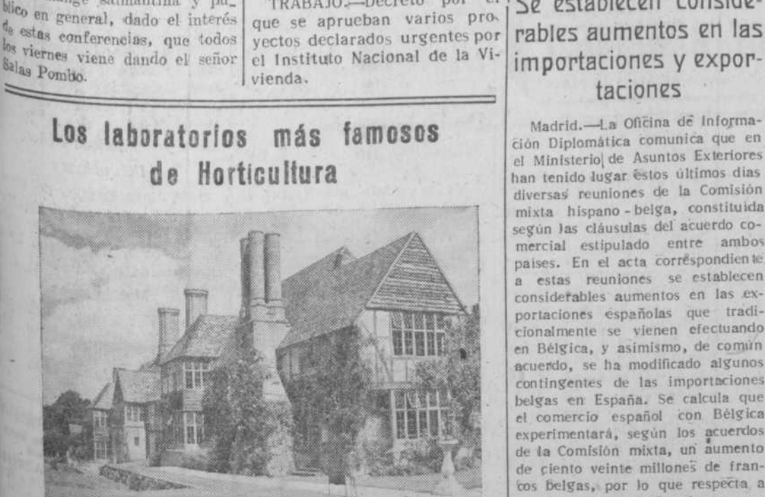
En estas edificaciones se encuentran actualmente instalados los laboratorios de la Real Sociedad de Horticultura británica, mientras que a su alrededor están los jardines que contienen la más variada colección de plantas del mundo

Los laboratorios más famosos de Horticultura