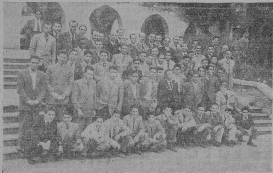
Los alumnos de la Escuela Elemental de Trabajo, de Salamanca, con sus profesores, en Madrid.

Hemos pasado, con los alumnos de la Escuela de Salamanca, unos días en la residencia del Ministerio de Trabajo. Allí todo es afecto, atención, tranquilidad y enseñanza. Para los sesenta muchachos, el viaje de estudios es como un sueño. Muchos de ellos, la casi totalidad no habían visto Madrid y difícilmente los medios económicos se lo hubieran permitido. Pero no es un conocimiento a modo de proyección turística. Por eso a la vez que con las conferencias a cargo de las más pres-