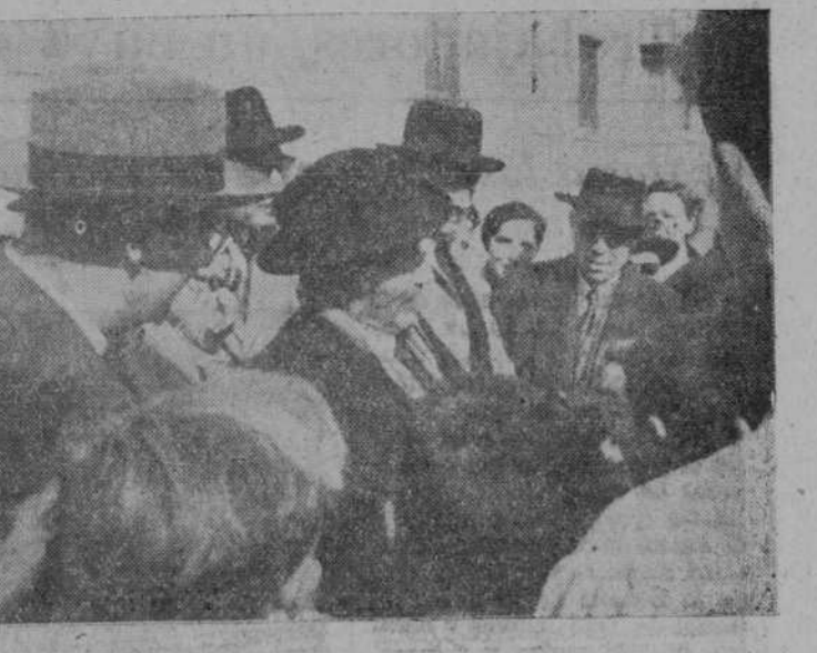
Los presidentes de Tribunales tutelares en su visita al Colegio-Hogar San José