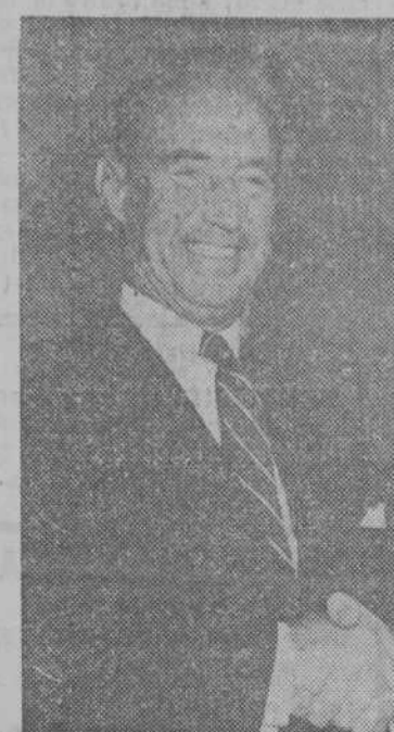
El presidente Eisenhower invitó recientemente a Adlai Stevenson, su adversario demócrata en las elecciones presidenciales norteamericanas, a celebrar una entrevista en la Casa Blanca, en el curso de la cual trataron del viaje que el señor Stevenson se propone emprender alrededor del mundo. Después se reunieron a comer con varios señores y diputados en la Casa Blanca