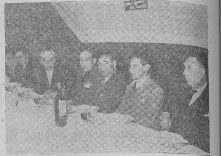
Presidencia de la comida de confraternidad del Sindicato provincial del Espectáculo

Misa en San Juan de Sahagún y comida de confraternidad