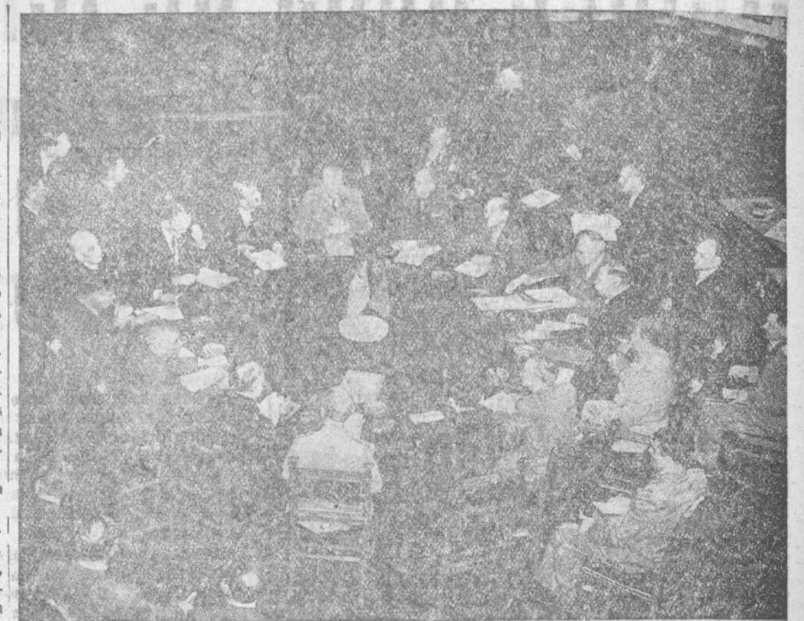
La conferencia de Potsdam, celebrada en 1945, acordó normas de política, que han sido violadas por la URSS

Febrero de 1946. Se reúne la O. N. U. en Londres y se reitera la declaración de Potsdam. La llamada "cuestión española", entra en su fase más crítica el 8 de abril, cuando el representante polaco, siguiendo las directrices de Moscú, plantea el problema ante el Consejo de Seguridad. Nada menos se dice entonces que "España constituía un serio peligro para la paz mundial". Es increíble que semejante desatino pudiese tomarse en serio, y sin embargo, ni Inglaterra ni los Estados Unidos sacrifican su