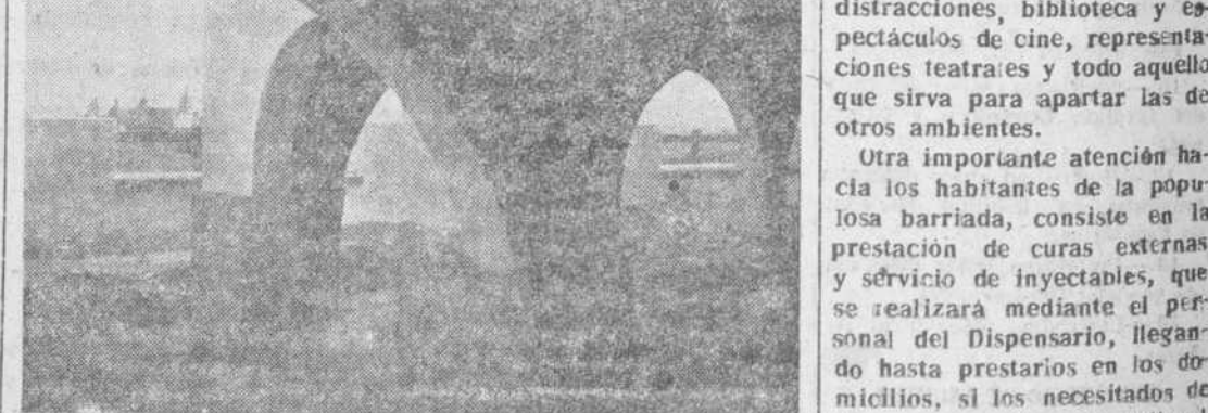
Los porches exteriores del edificio dejan ver a lo lejos una bella perspectiva de la ciudad

que no puedan recibir estas enseñanzas durante el día. Y como complemento de esta gran labor que va a realizarse por la generosidad y el espíritu del Consejo de Administración de la Institución salmantina, sección recreativa para los domingos y días festivos, a la que podrán acudir las niñas y jóvenes, proporcionándose distracciones, biblioteca y espectáculos de cine, representaciones teatrales y todo aquello que sirva para apartar las de otros ambientes.