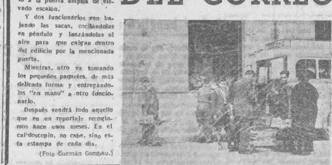
La escena se repite varias veces al día. El coche —ese pequeño ómnibus para pocos viajeros y muchas sacas— para en la fachada lateral del "Palacio de Comunicaciones", junto a la puerta amplia de elevado escalón. Y dos funcionarios van bajando las sacas, oscilándolas en péndulo y lanzándolas al aire para que caigan dentro del edificio por la mencionada puerta. Mientras, otro va tomando los pequeños paquetes de más delicada forma y entregándolos "en mano" a otro funcionario. Después vendrá todo aquello que en un reportaje recogimos hace unos meses. En el calidoscopio, no cabe, sino esta estampa de cada día.