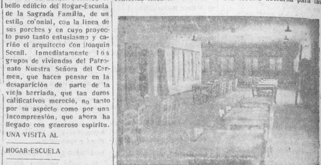
La amplia nave del taller-escuela, salón de actos y de recreos

de Ledesma, se ofrece la más admirable perspectiva de lo que en el barrio de los Pizarrales se ha hecho. Primero el bello edificio del Hogar-Escuela de la Sagrada Familia, de un estilo colonial, con la línea de sus porches y en cuyo proyecto puso tanto entusiasmo y cariño el arquitecto don Joaquín Secall. Inmediatamente los grupos de viviendas del Patronato Nuestra Señora del Carmen, que hacen pensar en la desaparición de parte de la vieja barriada, que tan duros calificativos mereció, no tanto por su aspecto como por una incomprensión, que ahora ha llegado con generoso espíritu.