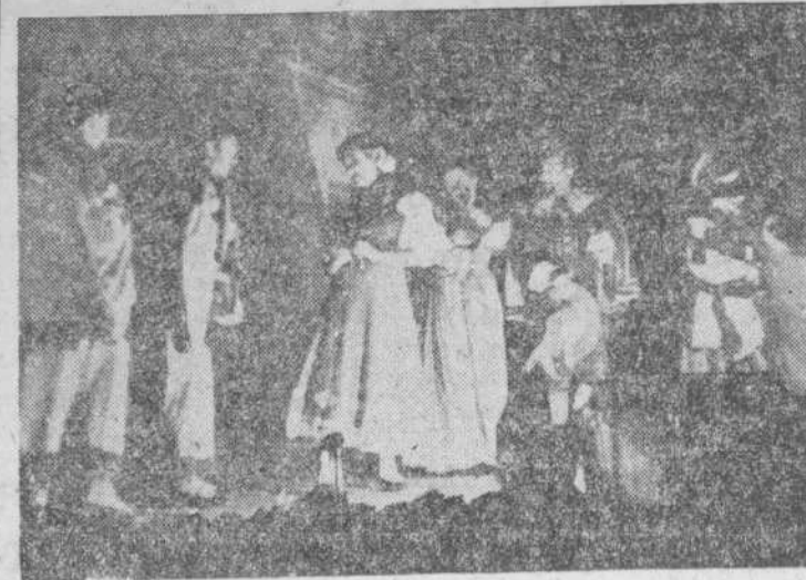
Una escena de "La guardia cuidadosa", representada por el TEU, anoche, en la calle de las Ursulas