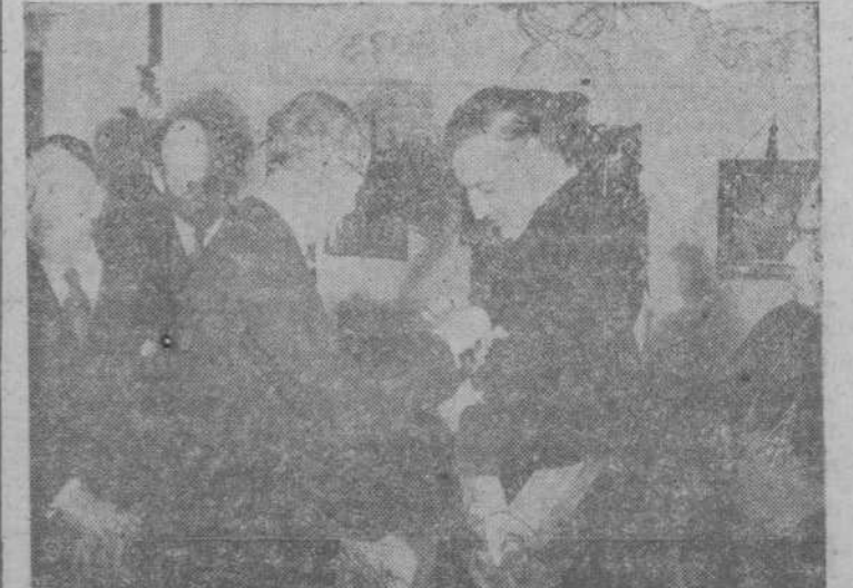
El embajador de Venezuela, señor Mijares, en el momento de imponer al ministro de Asuntos Exteriores, señor Martín Artajo, el gran cordón de la Orden del Libertador, acto celebrado en los salones de la Embajada de Venezuela