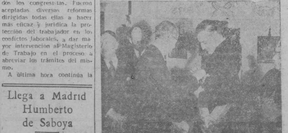
El embajador de Venezuela, señor Mijares, en el momento de imponer al ministro de Asuntos Exteriores, señor Martín Artajo, el gran cordón de la Orden del Libertador, acto celebrado en los salones de la Embajada de Venezuela