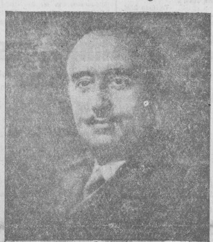
Yo creo que poco a poco, pese a las situaciones gravísimas por las que España ha pasado, y a las dificultades que encierra el constituir y levantar una Organización sindical, tras haber caído los viejos Sindicatos marxistas españoles en los horrores que la España roja registra, vamos alcanzando una plenitud de organización en la que prospera el buen sentido, el patriotismo y la voluntad de colaboración, que claramente se acusa en las reuniones de estos días, y que viene demostrando la razón de nuestra Organización sindical.

Nosotros, que alumbramos un régimen con dolores y sacrificios, con el derramamiento de nuestra propia sangre, no podíamos mantener aquella falsedad, volver a parecidas falsedades. Al sistema democrático formalista teníamos que oponerle un sistema más real, leal y sentido. Y fuimos a lo que bajo aquel falso tinglado permanecía vivo, a las agrupaciones naturales del hombre, a la familia, al Ayuntamiento y al Sindicato, donde sus actividades discurren y los hombres voluntariamente se asocian. Tuvimos que buscar en ellos los caminos por donde se pudiera llegar a la cooperación del hombre en la vida del Estado, la colaboración del hombre en el Gobierno de la nación, que permitiera el diálogo permanente entre el Gobierno y la patria.