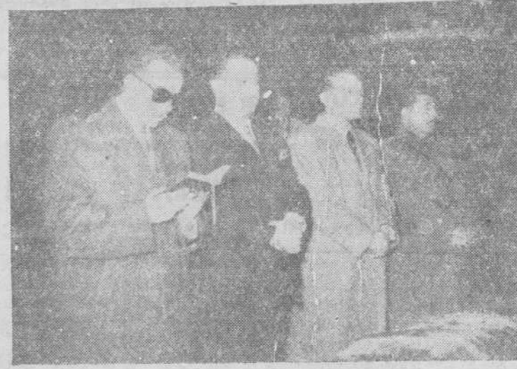
Presidencia, durante la misa

En el día de ayer, con motivo de la festividad de San Alberto Magno, la Facultad de Ciencias, en colaboraci6n con el S. E. U., organiz6 diversos actos para honrar, de esta forma, a su Santo Patr6n.