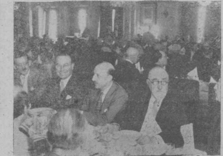
A la derecha: Un aspecto del comedor durante el acto.