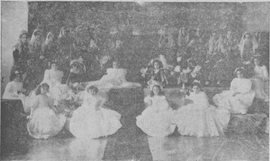
La Virgen de la Vega, Reina de los Juegos Florales, y la Corte de honor