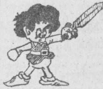
"Garbancito de la Mancha", por Carlos Pérez.