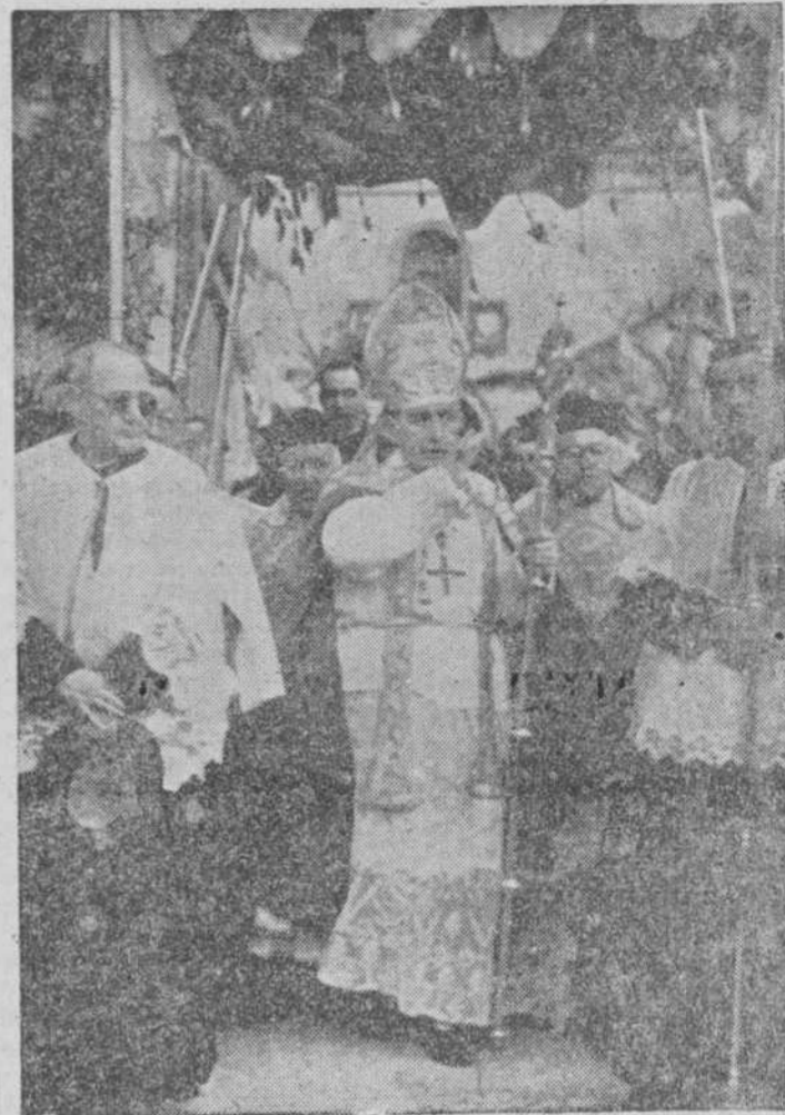
El doctor Yurramendi entrando, bajo palio, en Ciudad Rodrigo el día 28 de abril de 1946

Los prelados de otras diócesis han llamado también anunciando su llegada a Ciudad Rodrigo para asistir al entierro del cadáver del doctor Yurramendi. Se cree que el primero que llegará será el obispo de Avila, doctor Moro Briz.