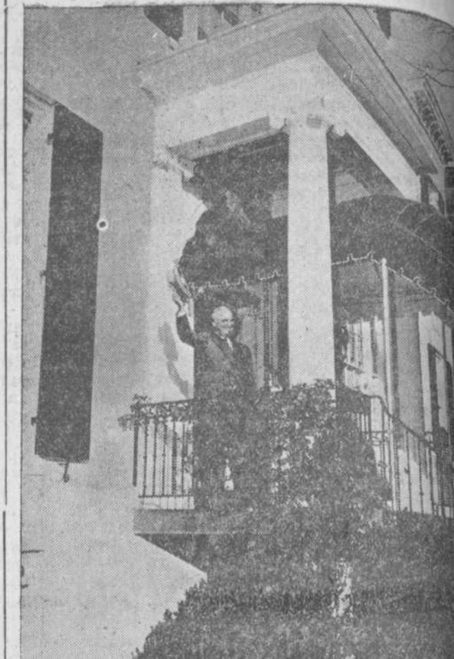
El presidente Truman saluda desde la entrada de la Villa Blair al llegar a su residencia provisional, después de pasar unos días de vacaciones en Florida