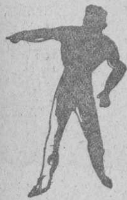
La sombra de Tarzán, por Luis Iglesias Briñón.

Dos niños se disponen a jugar subidos a horcajadas en una viga de cuatro metros de larga. La colocan sobre una piedra, apoyada en su punto medio, y se suben cada uno en su extremo. Pero como uno de los niños pesa veinte kilos y el otro treinta, no logran su intento por más esfuerzos que hacen; permaneciendo el menor en las alturas, sin poder contrarrestar el peso del mayor. ¿Cómo se las arreglarán para poder balancearse?