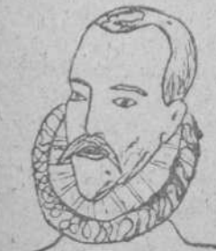
Miguel de Cervantes, por Angel Merchán, Guijuelo.