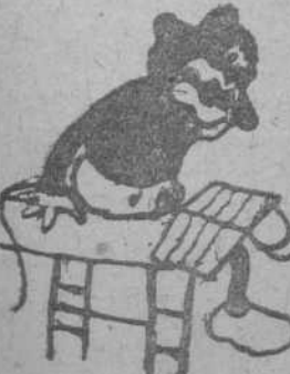
El mono estudioso, por Pepito Martín, Linares de Riofrío.