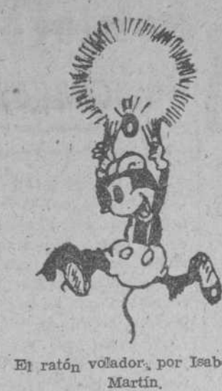
El ratón volador, por Isabella Martín.

Es el diario más antiguo de la capital y provincia