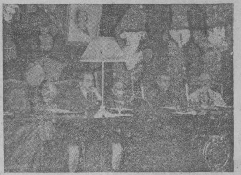
El cardenal primado de España, doctor Pla y Deniel, con el obispo precanizado de Bilbao, el subsecretario de Educación Nacional y otras personalidades, presidiendo el acto celebrado en la Cámara de Comercio de Madrid.