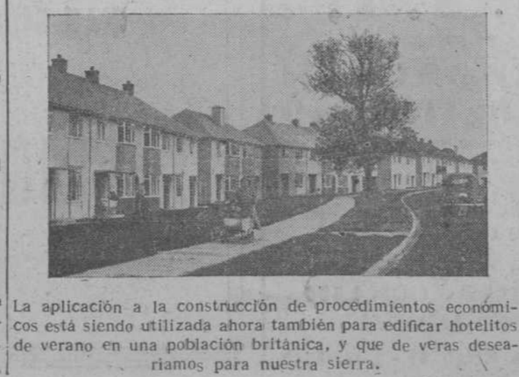
La aplicación a la construcción de procedimientos económicos está siendo utilizada ahora también para edificar hoteliticos de verano en una población británica, y que de veras deseamos para nuestra tierra.