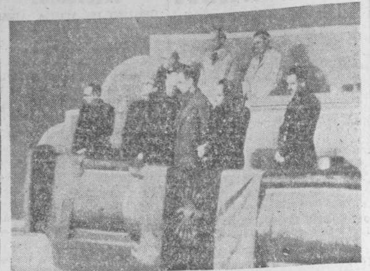
Las autoridades en el palco del Cinema Salamanca durante el acto conmemorativo