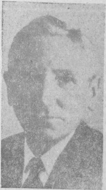
MAC VEAGH

Su Excelencia estaba acompañado durante la celebración del acto, por el ministro de Asuntos Exteriores, teniente general jefe de la Casa Militar, jefe de la Ca-