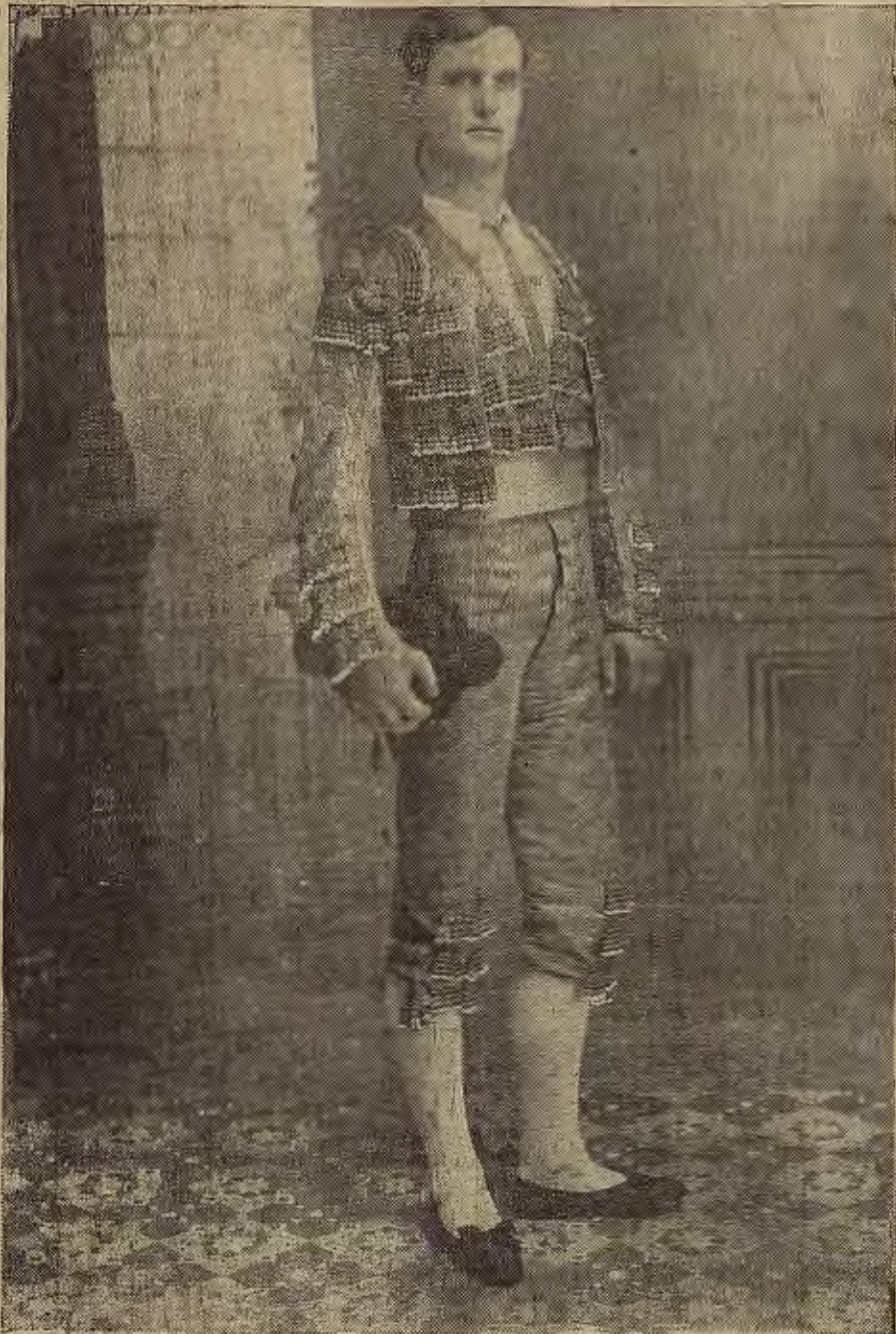
Fotografía de Villalta hecha el día que el maestro aragonés vistió por primera vez el traje de luces.