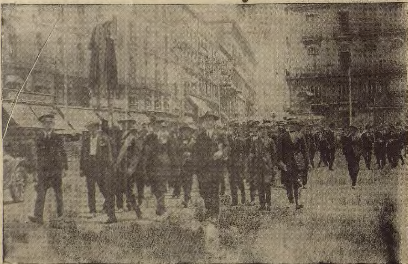
MADRID—El Orfeón Zaragozano al pasar por la Puerta del Sol con su estandarte