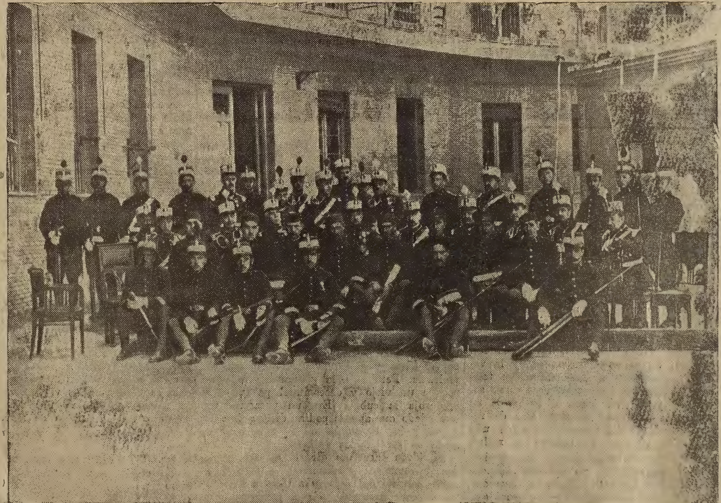
FIESTA DE LOS INGENIEROS PONTONEROS EN HONOR DE SU PATRON SAN FERNANDO. — Reparto de premios efectuado ayer en el cuartel de San Genis.

En Asó (Tarragona), un vecino de la villa tuvo la desgracia de ser arrollado por un tren al atravesar la vía. Resultó con gravísimas heridas que hicieron necesaria la amputación de ambas piernas.