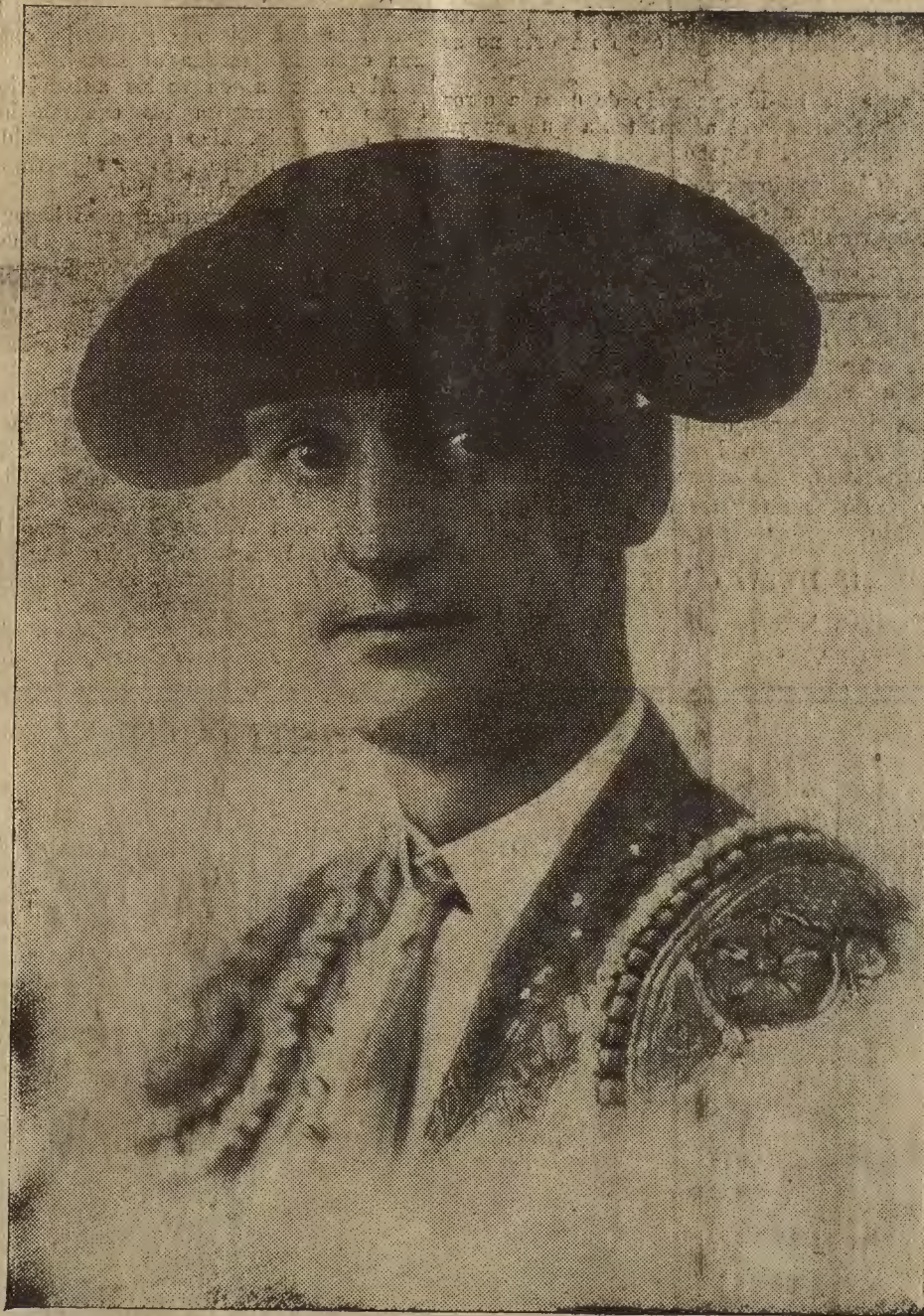
FIGURA DE ACTUALIDAD.—El matador de toros aragones Nicanor Villalta a quien sus amigos y admiradores obsequian hoy con un banquete para celebrar los triunfos que ha alcanzado esta temporada