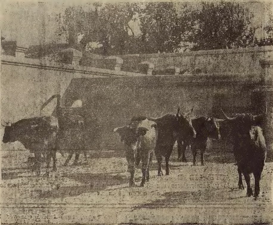
Los toros de Flores que lidiarán esta tarde en la plaza de Zaragoza los diestros «Lagartillo» y Lorenzo Franco