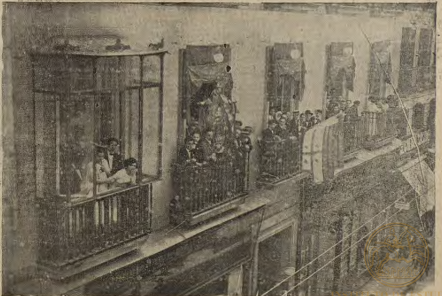
EL ORFEON ZARAGOZANO EN MADRID.—En los balcones del Círculo Aragonés con la bandera de dicha Sociedad y la Diputación de Huesca