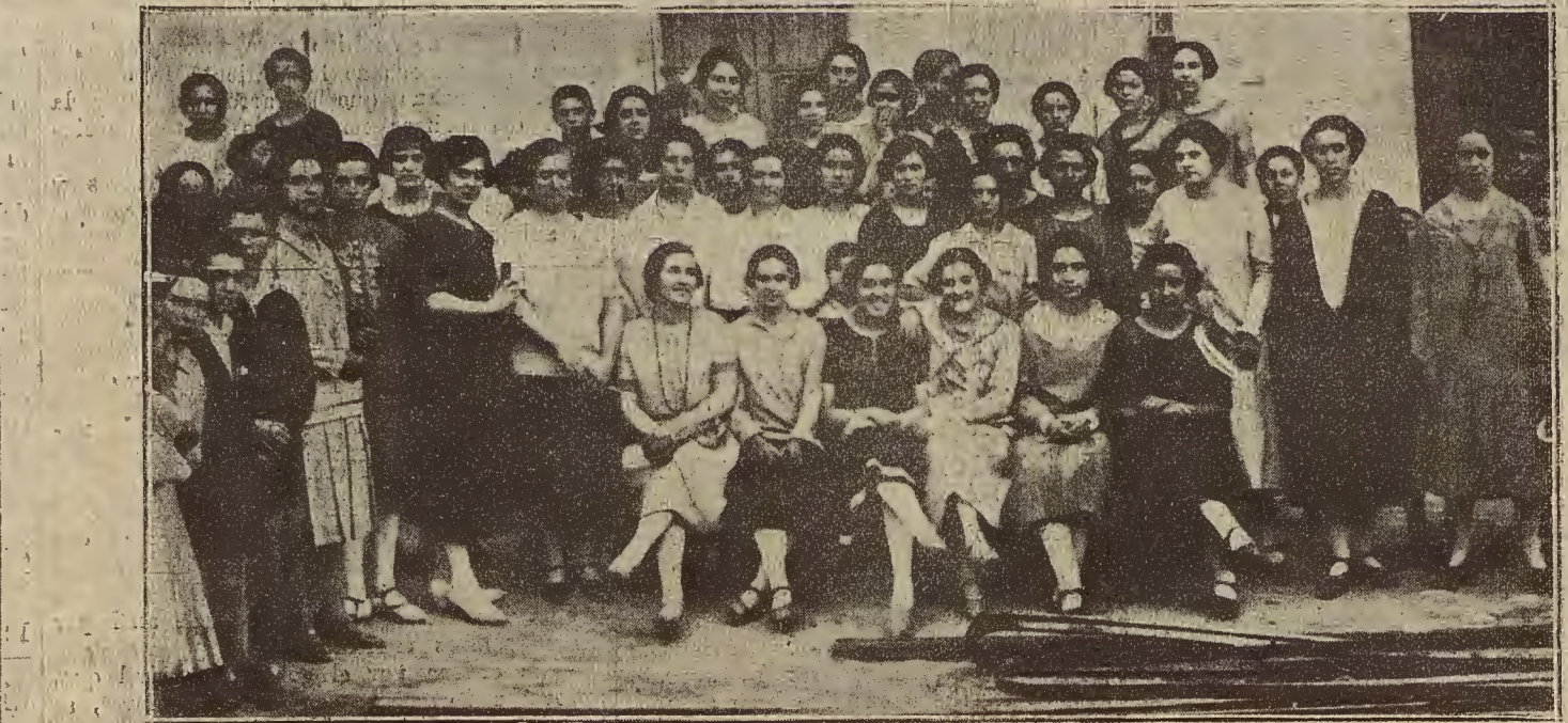
DE LAS FIESTAS DEL BARRIO DE SANTA ISABEL.—Señoritas que con su presencia dieron a los festejos la nota más agradable.

hierro, reciben el agua de una bomba que la aspira y comprime a la presión indicada. La bomba es accionada por un motor de 20 caballos.