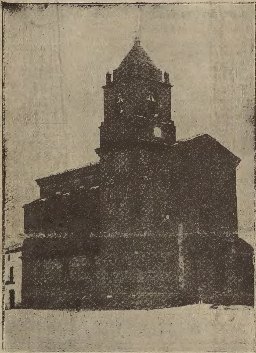
ARAGON, PINTORESCO.—La iglesia del pueblo de Esquedas (Huesca).