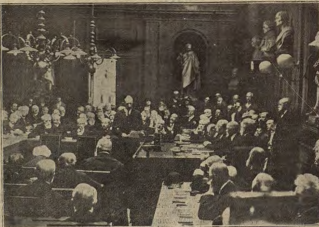
EL REY DE ESPAÑA EN PARÍS.—D. Alfonso XIII leyendo su discurso al ingresar en la Academia de Bellas Letras.

Mártires, núm. 16 (Arco de Cineja) Piel. Matriz. Vías urinarias DIATERMIA SOL DE ALTURA