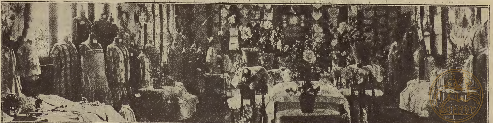
LAS EXPOSICIONES ESCOLARES EN ZARAGOZA.—Aspecto del local de las escuelas de aprendizas, sostenidas por el Ayuntamiento. (Foto Invitación Barrera).