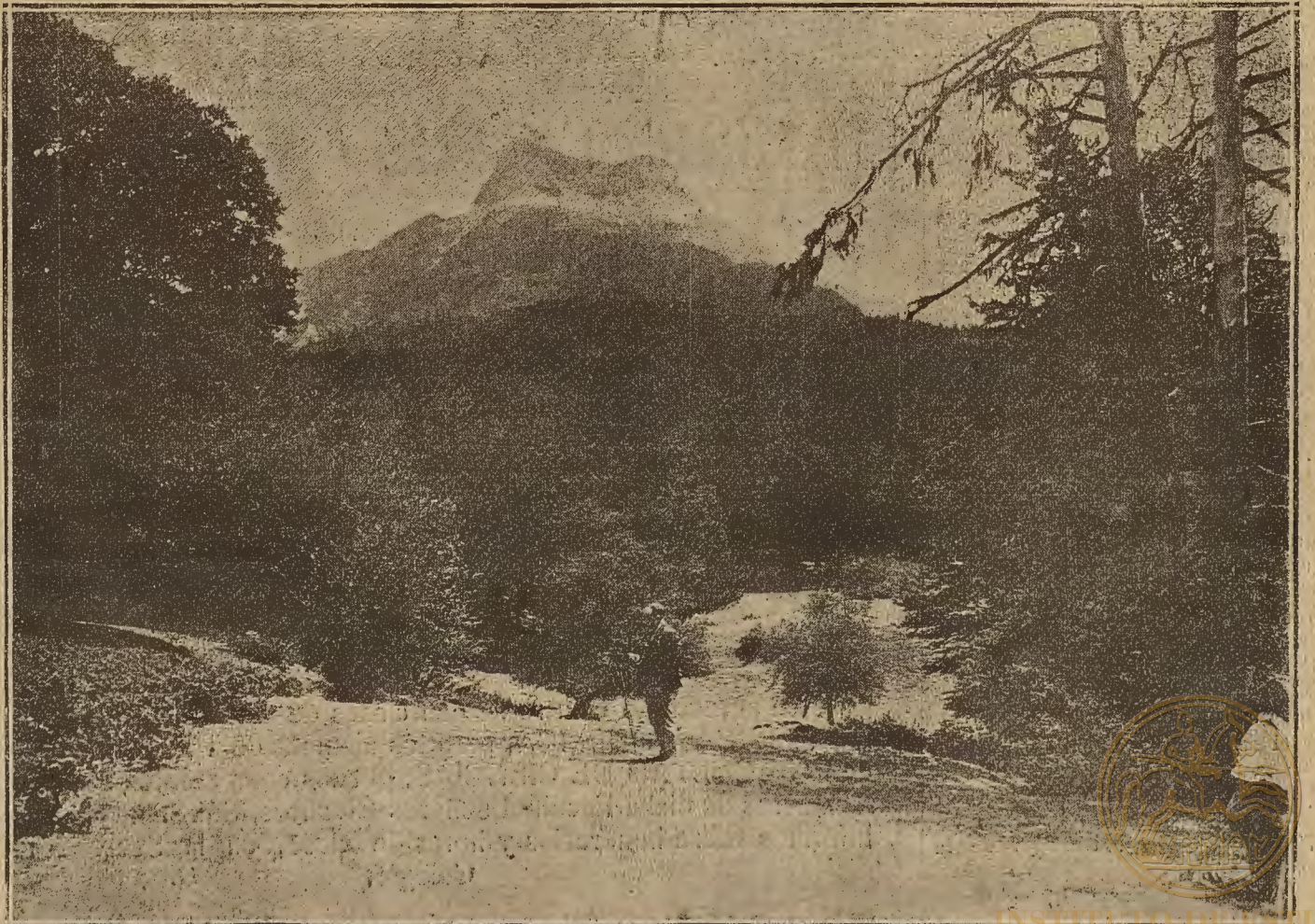
ARAGON PINTORESCO.—Valle de Hecho: Oza. Pico de Achert

El conferenciante fué muy felicitado por su labor y elogió mucho el orden, disciplina y trabajo que en las Clínicas de la Facultad se observa y de las cuales la Universidad puede sentirse muy ufana.