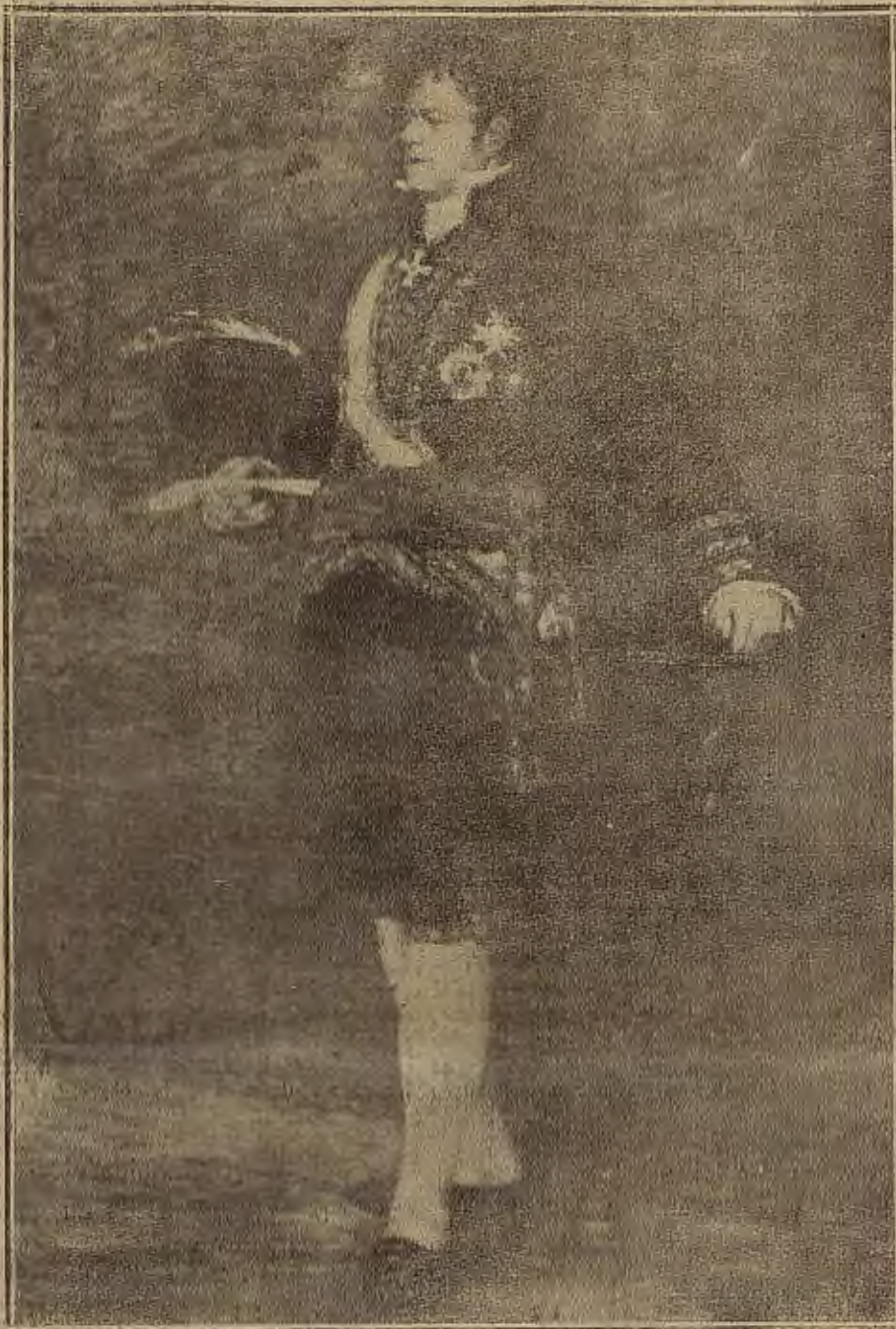
ARTE ARAGONES.—Retrato del duque de San Carlos, pintado por D. Francisco de Goya, que se conserva en nuestro Museo provincial.