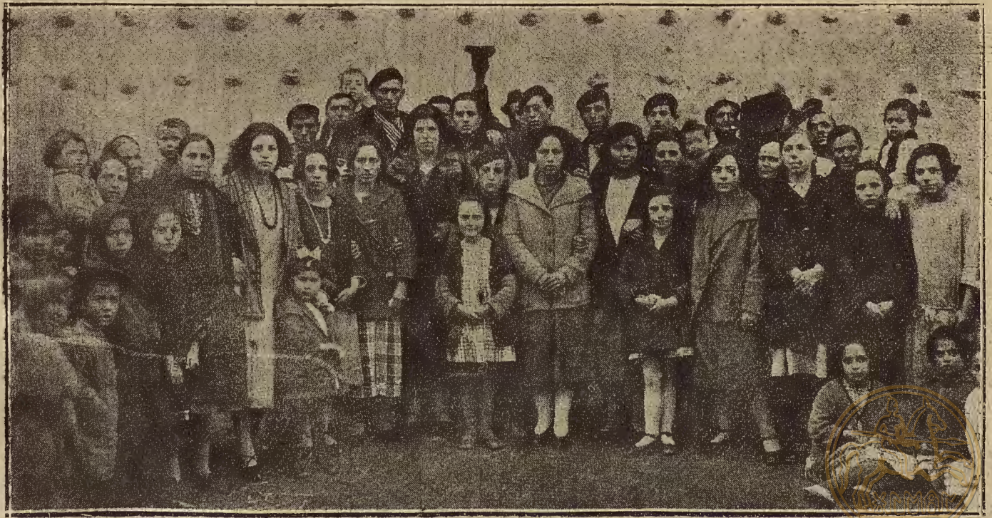
EN SANTA CRUZ DE GRIO: LAS FIESTAS DE SAN BLAS.—La gente joven, que en eso se divierte, no se ha dado punto de reposo

TELEFONOS DE "LA VOZ," Redacción . . . . . 27 Administración . . . . . 857