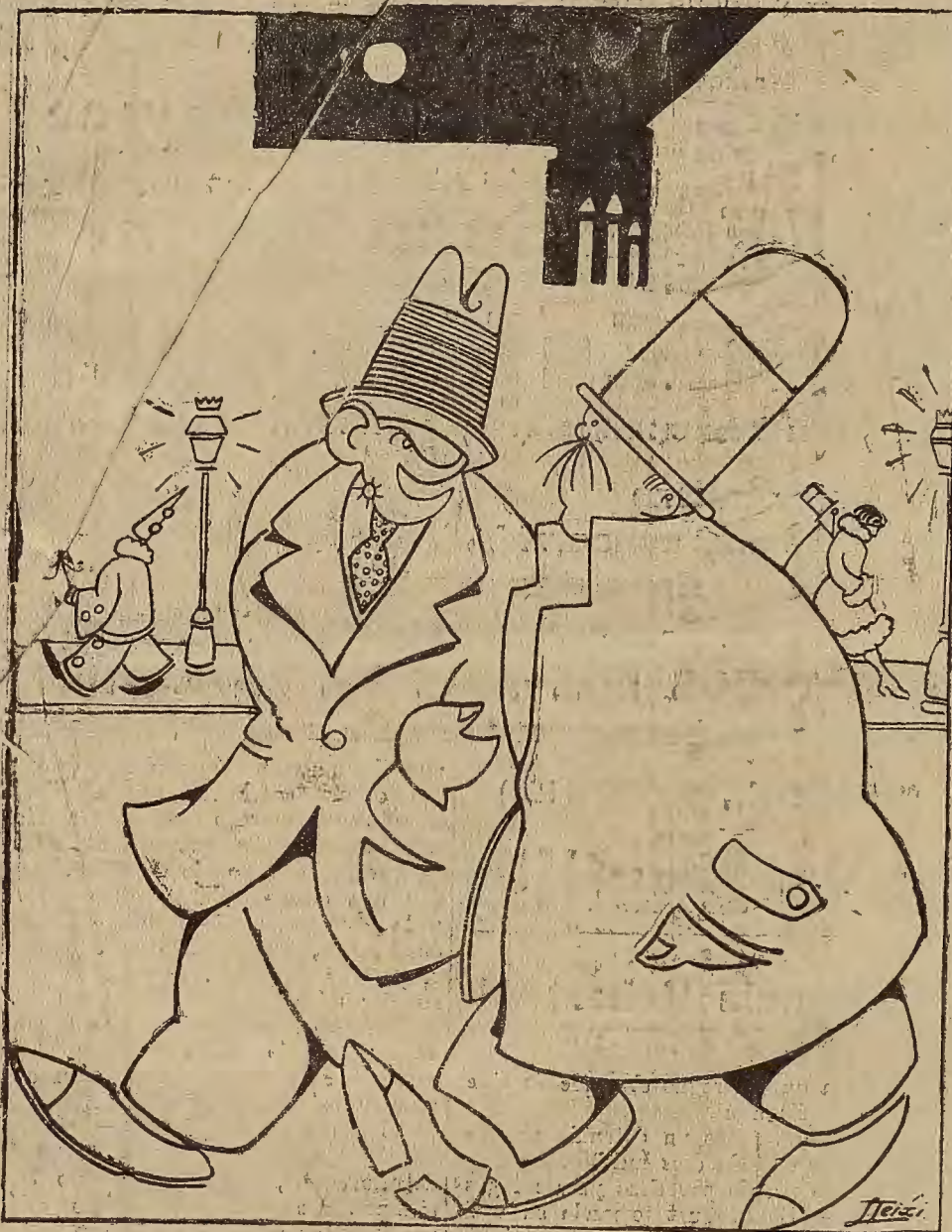
—Diré a mi mujer que he estado velando un cadáver. —Por si acaso, añades que era fabricante de «confetti».

nicas que sus cinco esposos consecutivos fueron otros tantos hombres desgraciados.