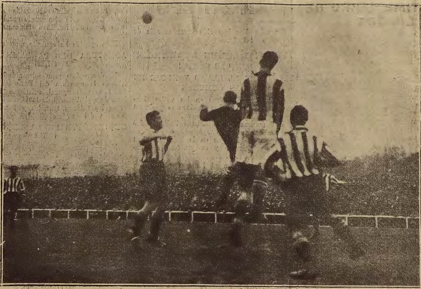
FUTBOL EN MADRID.—UN MOMENTO DEL PARTIDO DE CAMPEONATO DE PRIMERA CATEGORIA JUGADO ENTRE EL R. S. GIMNASTICA Y EL ATHLETIC

Las consecuencias de estas enormes mutilaciones en un organismo tan finamente equilibrado como la economía alemana han sido desastrosas. Sobre todo, porque Alemania no puede sostenerse económicamente si permanece aislada del resto del mundo. La mayor o menor prosperidad de su vida económica depende de la mayor o menor intensidad de sus relaciones con el mercado mundial. No puede Alemania recurrir a la solución de encerrarse dentro de sí misma para escapar a las consecuencias de la crisis. Ni siquiera Europa, en su conjunto, dispone de fuerzas suficientes para resolver por sí misma los problemas que le agobian. Dondequiera que el espectador dirija la mirada el espectáculo es fundamentalmente el mismo. Euro-