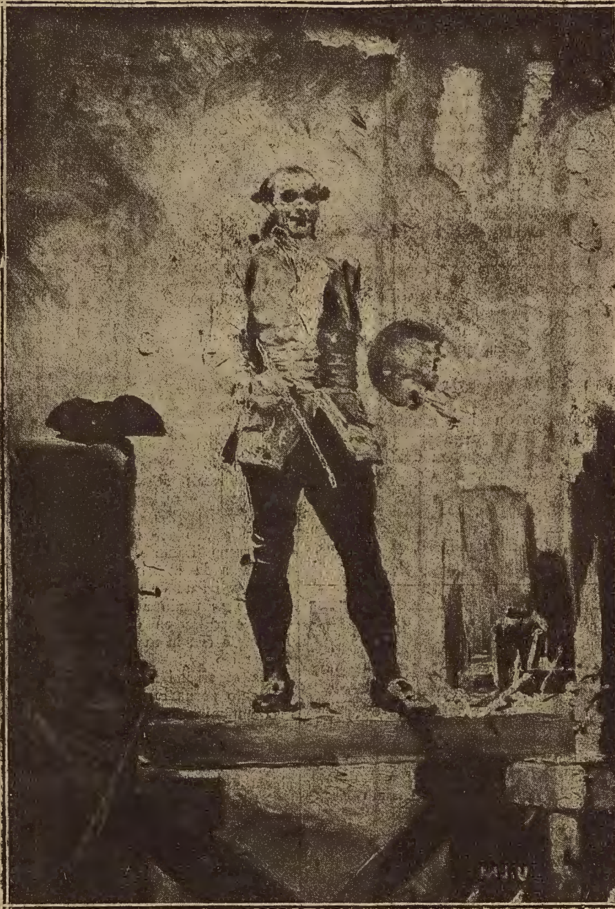
ARTE ARAGONES.—GOYA PINTANDO UNOS FRESCOS. CUADRO DE MARCELINO DE UNCETA, QUE SE CUSTODIA EN EL MUSEO PROVINCIAL DE ZARAGOZA.

Y allí entró alguien. ¿EL? ¿ELLA? ¿Alguien! Acaso el demonio de los celos, acaso el de la ingratitud, acaso el de un amor que muriera... Tal vez el de un pecado añejo que pareció