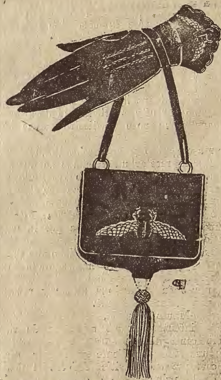
A este guante de piel gris con bordados plata y «nattier» acompaña un bolso también gris con bordados plata, «nattier» y borla de sedas en los tres tonos mezclados.