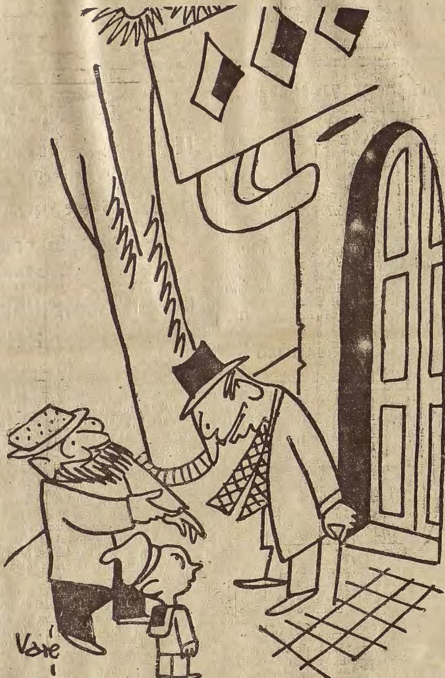
LA CARICATURA EXTRANJERA

—Es que había «salchichas» y otras «liserias».