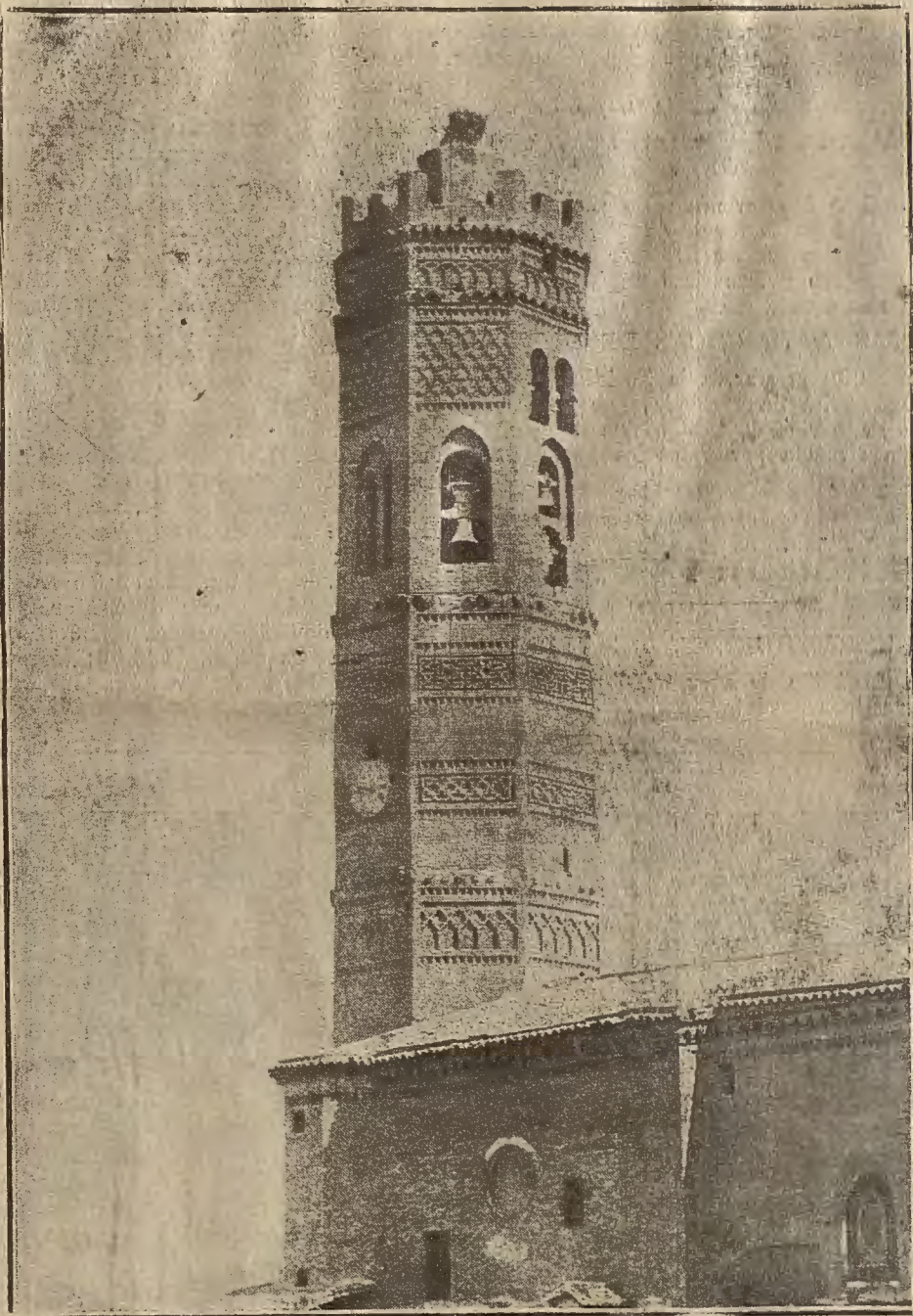
RIQUEZA ARTISTICA Y MONUMENTAL DE ARAGON.—La torre de Tauste.