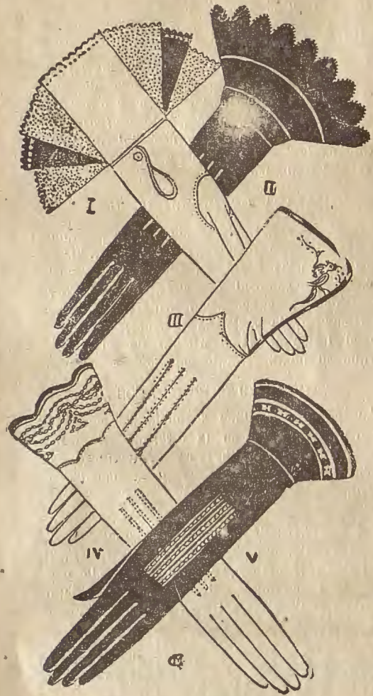
1.—Guante de piel de Suecia color tabaco, con manopla en tonos tabaco, marrón y «beige». 2.—De cabritilla negra y vivos blancos. 3.—De piel color avellana y bordadito en color. 4 y 5.—Son de estilo romántico en piel blanca con cadenas y en cabritilla marrón con bordaditos «beige». parente seda, y oculta sus manos bajo caprichosos guantes de piel.

Es curiosa la influencia que ejerce la largura de la falda sobre las dimensiones de la puntera en el calzado. Cuando vino la falda larga, el zapato adoptó la punta afilada de influencia norteamericana. Al volver la falda corta y estrecha, estas punteras, aumentando el pie dos centímetros eran de un efecto desproporcionado y poco coquetón. El calzado de ahora vuelve a tener dimensiones normales; la puntera redondeada, ni tan corta como antes que hacia el pie de china,