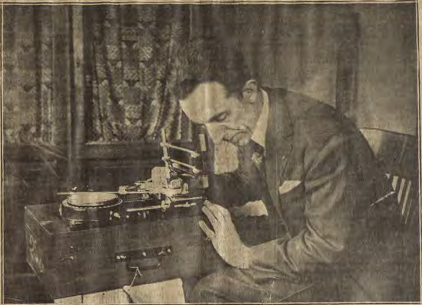
LOS PROGRESOS DE LAS CIENCIAS.—El ingeniero francés comandante Le Prieur, con el aparato «Navigraph», de su invención, destinado a corregir en la navegación aérea los errores de orientación por causa de la influencia de los vientos.

Salida de Tarazona a las 3,30 de la tarde.