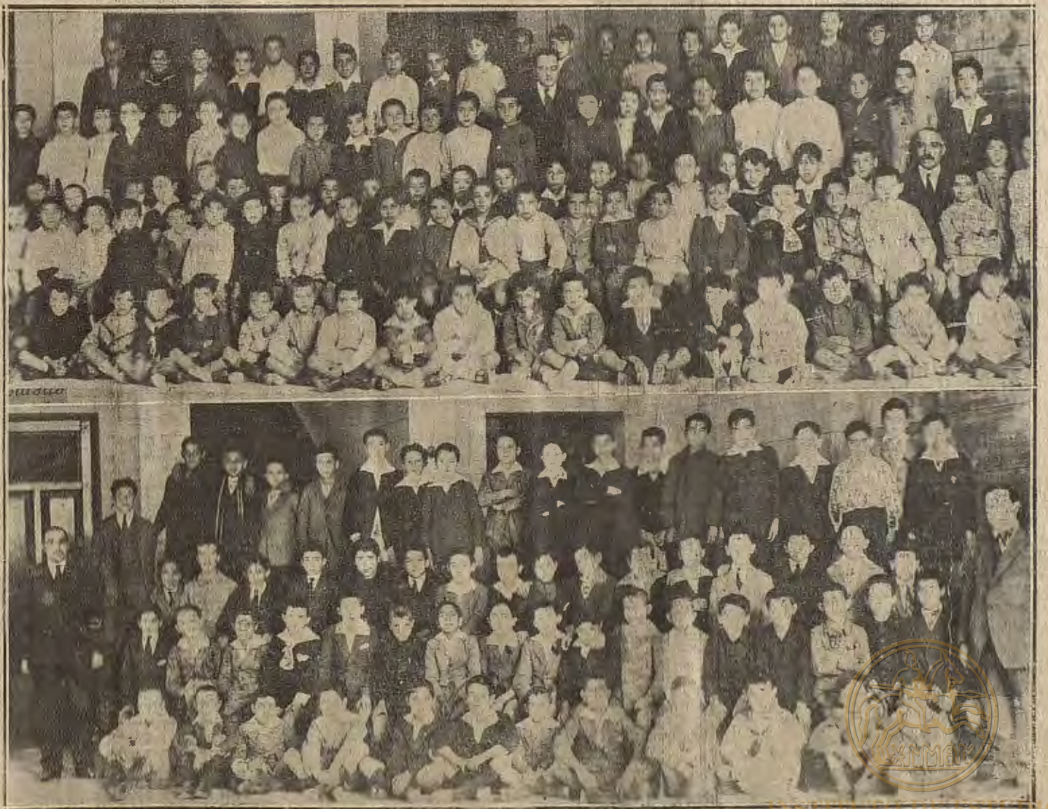
LAS EXPOSICIONES ESCOLARES EN ZARAGOZA.—Niños de la Escuela de Ramón y Cajal

«Lector, se te ruega indagues el paradero de un caballejo pío, oscuro, de escaso valor, blanco de cara, pío y costado, y un poco claro por la cola. Lo hurtó Juan Rotherham. La persona que haga averiguaciones y dé con el animal y traiga o envíe noticias, recibirá lo que juzgue pertinente como recompensa a sus molestias».