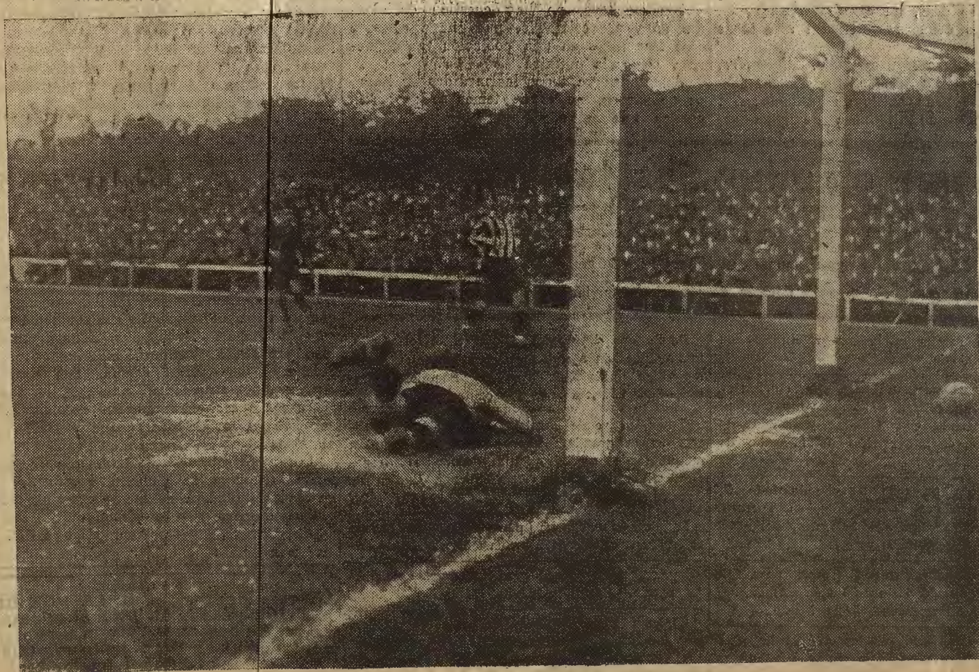
MADRID.—Un momento del partido de fútbol, jugado entre el Arenas, de Guecho y el Athletic de Madrid

El alcalde, no obstante, aplazó la aceptación de la dimisión presentada.