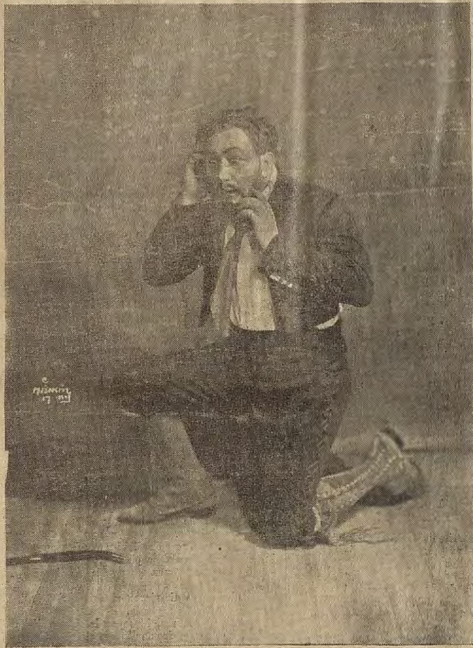
Miguel Fleta en la ópera «Carmen»

Escuchóle Miguel Aso, el conocido canta-