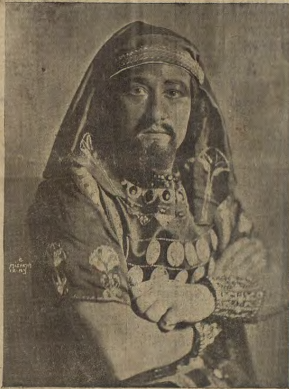
FIGURA DE ACTUALIDAD.—El gran tenor aragonés Miguei Fleita en la ópera "Aida"

cia, (jamás estuve afiliado a ninguna cofradía política) mi desinterés, mi proyección a la imparcialidad y a la justicia, encontrarán en esta hoja impresa el marco que necesitan. ¿Caciquear? Núfíca. La política pudo inspirarme muchas docenas de artículos; pero sobre todo me inspiró repugnancia. ¿Capitanear pandillas de oligarcas? Tampoco. ¿Ser un almogabar suelto. ¿Hacer odiosas distinciones con relación a las personas? Menos. Para mí todos los mortales son hijos de Dios. Mi lema será siempre: «A cada cual lo suyo», que es el más alto principio de justicia; y «Aragón sobre todo y sobre todos», que es lo que nos importa a los aragoneses.