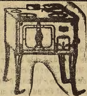
Ma trasladando sus talleres, por ampliación de negocio a la calle Mayor, núm. 61.