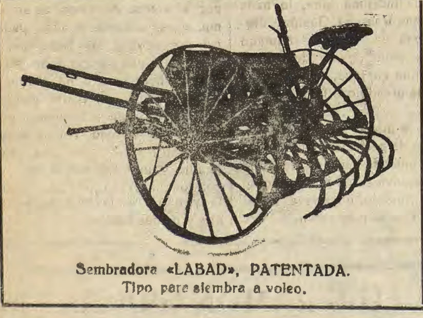
Sembradora «LABAD», PATENTADA. Tipo para siembra a voleo.

El que más barato vende toda clase de drogas, sosas, azufres, azulejos blanco y color, cocinas económicas Hierros, Drogas y Ferretería Joaquín Lafarga:Huesca